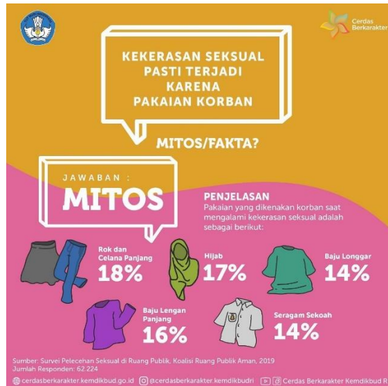
Gambar 1.3 Jenis Pakaian Korban Pelecehan Seksual