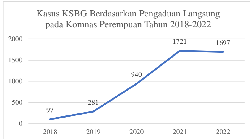
Gambar 1.1 Jumlah Kasus Kekerasan Siber Berbasis Gender (KSBG) pada Tahun 2018-2022

(Sumber: https://komnasperempuan.go.id/catatan-tahunan , 2023)