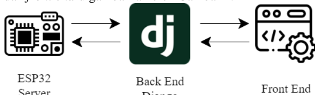
Diagram hubungan antar komponen

Alat yang dirancang untuk sistem yang dikembangkan dalam proyek ini terdiri dari dua ESP32 Client dan satu ESP32 Server . Sensor IMU terpasang pada ESP32 Client untuk melacak pergerakan pengguna. Dengan menggunakan koneksi BLE, kedua ESP32 Client ini mengomunikasikan data pergerakan ke Server ESP32. Selanjutnya, ESP32 Server memverifikasi apakah gerakan pengguna akurat atau tidak, mengirimkan temuan ke Django, yang berfungsi sebagai back end . Data diproses oleh Django dan dikirim ke front end , atau antarmuka pengguna, yang dibuat dengan HTML, CSS, dan JavaScript. Hubungan antara ESP32 Server , back end dan front end digambarkan oleh Gambar 1.