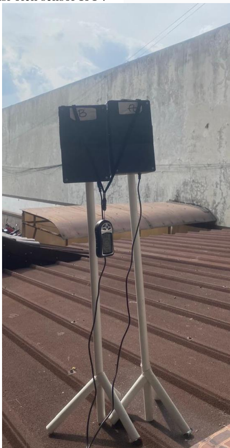
GAMBAR 6 Penempatan Pengujian Weather Station

Implementasi sistem weather station dapat ditempatkan pada berbagai media seperti tiang pada gambar 6 ataupun bisa ditempatkan pada tower komunikasi. Penempatan alat yang tepat dapat meningkatkan tingkat akurasi yang dapat terdeteksi oleh sensor IoT .