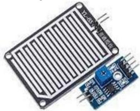
GAMBAR 4 Sensor Raindrop

Sensor raindrop merupakan jenis sensor yang berfungsi untuk mendeteksi terjadinya hujan atau tidak. Sensor ini dapat difungsikan dalam segala macam aplikasi dalam kehidupan sehari-hari. Prinsip kerja dari sensor ini adalah pada saat ada air hujan turun dan mengenai panel sensor maka akan terjadi proses elektrolisis oleh air hujan. Karena air hujan termasuk ke dalam golongan cairan elektrolit yang merupakan jenis air yang akan menghantarkan arus listrik.