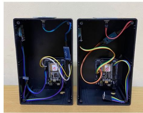
GAMBAR 7 Implementasi Sistem Weather Station

Dalam pengujian implementasi weather station, difokuskan pada pengujian tingkat akurasi sensor dalam mendeteksi parameter-parameter cuaca. Pengujian dilakukan di atap lantai 2 rumah dengan menggunakan dua perangkat yang memiliki spesifikasi sama antara keduanya seperti pada gambar 7. Selain itu, perbandingan nilai pendeteksian parameter sensor menggunakan alat keluaran pabrikan yang mampu mendeteksi parameter-parameter yang sama yaitu altimeter.