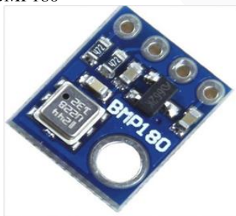
GAMBAR 3 Sensor BMP180

BMP180 adalah sensor tekanan barometrik (digital barometric pressure sensor) yang memiliki kinerja sangat tinggi. Sensor ini dapat diaplikasikan pada berbagai perangkat bergerak seperti smartphone perangkat bergerak lainnya. Sensor ini bekerja dengan menghubungkan antara