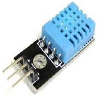
GAMBAR 2 Sensor DHT11

Sensor DHT11 merupakan sensor dengan kalibrasi sinyal digital yang mampu memberikan informasi suhu dan kelembaban udara. Sensor ini memiliki tingkat stabilitas yang sangat baik dengan fitur kalibrasi yang akurat. Koefisien kalibrasi disimpan dalam one time programmable (OTP) program memory, sehingga ketika internal sensor mendeteksi sesuatu maka modul ini menyertakan koefisien tersebut dalam kalkulasinya [4].