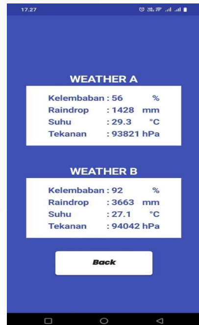
GAMBAR 8 Nilai Deteksi Raindrop Pada Aplikasi

Pengujian data hujan dilakukan dengan meneteskan air kepada komponen sensor raindrop yang berada di atas device. Data dari setiap device terlihat seperti pada gambar 8 yang merupakan hasil uji data.