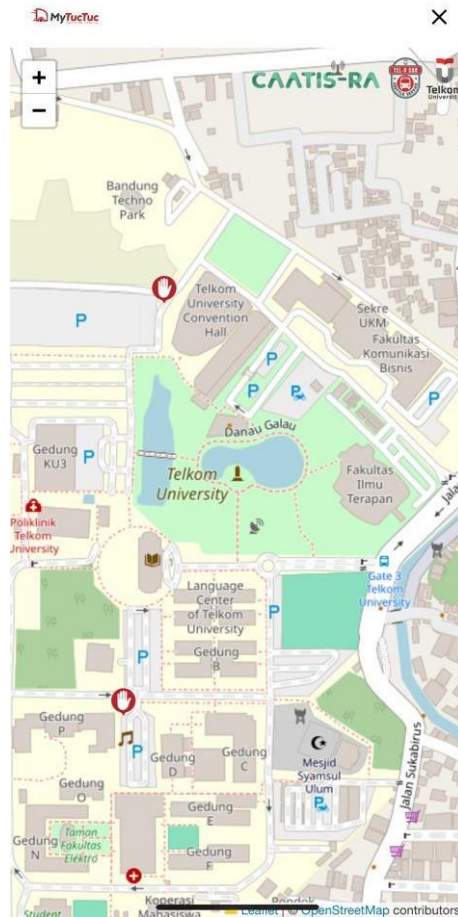
Gambar 1. 2 Aplikasi mytelu

masih belum tersedia. Layanan ini juga tersedia di monitor gedung TULT, namun masih memiliki kekurangan juga karena untuk memonitor bus secara realtime , sopir bus harus mengkonfirmasi dulu agar icon bus yang ada di monitor dapat berjalan, dan layanan tersebut juga belum menampilkan informasi estimasi waktu kedatangan bus ke gedung TULT.