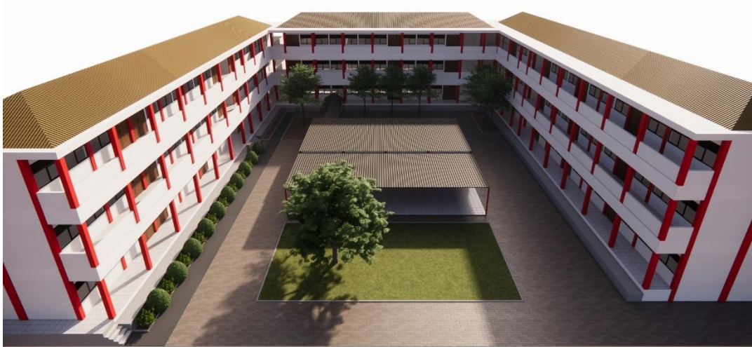
Gambar 1. 1 Perspektif SMK Telkom Bandung