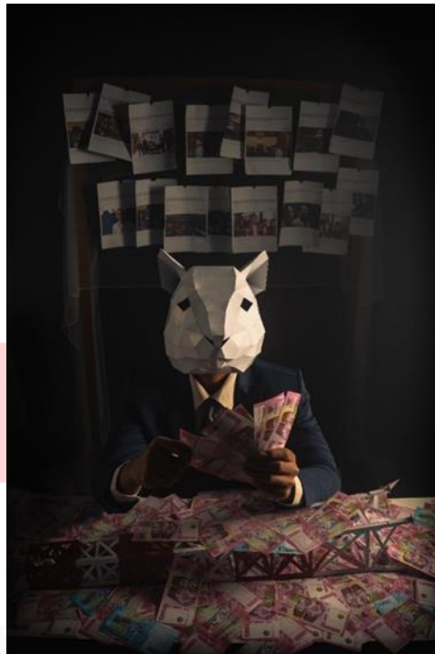
Gambar 6 Money is Everything

Karya fotografi yang berjudul " Money is Everything " menggambarkan seseorang sedang menghitung uang di atas meja, dengan miniatur tower yang roboh, sementara berita tentang korupsi BTS 4G terpampang di belakangnya. Meskipun berita itu seharusnya menjadi peringatan, akan tetapi ia tetap santai dan acuh tak acuh dengan perbuatannya. Dalam karya ini, seseorang bertopeng tikus sedang menghitung uang mencerminkan hasil dari tindakan korupsi. Beberapa berita online yang dicetak dan ditempel di belakang menggambarkan tentang skandal korupsi BTS 4G, sedangkan miniatur tower roboh menggambarkan kualitas pembangunan tower yang buruk. Sering sekali para pelaku korupsi merasa aman dan tidak tersentuh oleh hukum, meskipun tindakan mereka sudah merugikan masyarakat. Dengan adanya kekuasaan serta harta yang berlimpah mereka seakan bisa mengontrol semua masalah.