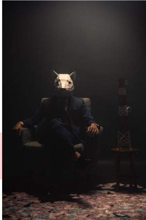
Gambar 5 Kursi Kekuasaan

Karya fotografi konseptual yang berjudul “Kursi kekuasaan”, menampilkan seseorang yang mengenakan topeng tikus dan setelan jas lengkap serta duduk di sofa dengan sikap tenang dan sangat percaya diri. Sementara di lantai ada uang yang berserakan, di samping kanan ada miniatur tower di atas meja kecil. Dengan latar belakang yang gelap menciptakan suasana misterius dan dramatis. Dalam karya ini, topeng tikus memiliki sifat yang licik dan rakus memiliki kesamaan dengan para koruptor yang rakus dan pandai berkelit. Miniatur tower menggambarkan korupsi BTS 4G dan setelan jas lengkap serta duduk di sofa mencerminkan posisi kekuasaan yang disalahgunakan untuk kepentingan pribadi dan kelompok dengan memiliki sikap angkuh dan merasa aman, sehingga koruptor merasa tidak akan tertangkap atau dihukum. Uang yang berserakan menggambarkan hasil dari korupsi yang dilakukan tidak peduli berapa banyak yang mereka ambil, mereka selalu menginginkan yang lebih sehingga merugikan masyarakat.