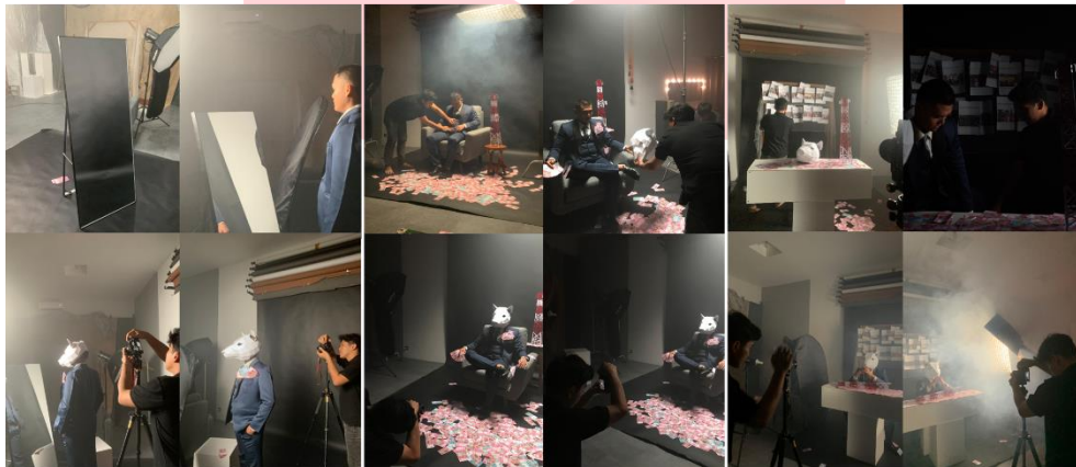
Gambar 2 Proses pengambilan sketsa paras hipokrisi, kursi kekuasaan, money is everything .