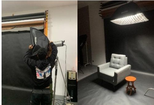
Gambar 1 Pengaturan pencahayaan lapangan di Studio