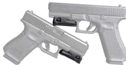
Gambar 1.2 Perangkat keras ALU, terletak di depan pelatuk

Senjata yang memiliki sistem pengawasan dan maintenance dengan perangkat lunak bukanlah hal baru. Memang sudah ada namun perangkat lunak ini tidak bisa diunduh untuk umum dan bukan platform open-source yang tersedia untuk umum. Contoh yang kami berikan adalah buatan perusahaan senjata Radetec yang berasal dari Amerika Serikat. Produk ini dinamakan Armorer Logbook Universal (ALU). Selain itu, ALU tidak bekerja melalui internet tapi komunikasi Near Field Communication (NFC).