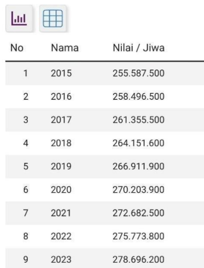
Gambar 1. 3 Populasi Penduduk Indonesia Sumber Gambar: Databoks (2023) (Diakses tanggal 12 Desember 2023)

komunitas Dayak dengan kelompok di luar komunitas mereka. Perubahan-perubahan ini, yang dapat dipengaruhi oleh perkembangan zaman dan pergeseran nilai-nilai sosial, mencerminkan kompleksitas hubungan antara keyakinan tradisional komunitas Dayak dengan struktur sosial dan agama yang lebih dominan di wilayah Desa Krimun.