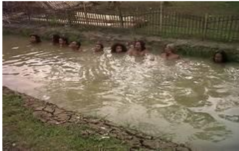
Gambar 1. 1 Ritual Tapa Ning Jero Banyu (Bertapa Di Dalam Air)

ditanggung oleh pria. Ritual tersebut merupakan simbol penting dalam kepercayaan mereka dan memperkuat ikatan spiritual antaranggota komunitas Dayak di Indramayu.