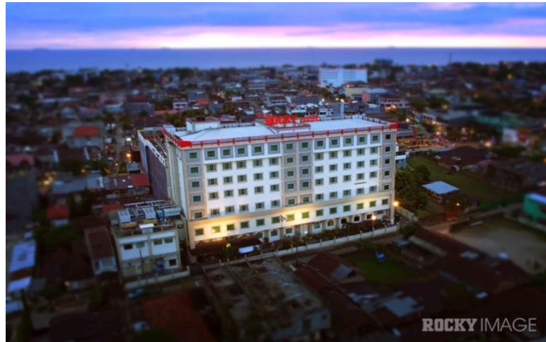
Gambar 1. 2 Tampak Rocky Plaza Hotel Padang

Alamat : Jl. Permindo No. 40 Padang Sumatera Barat Phone / Fax : 0751-840888 / 0751-841230 Website : www.rockyhotelsgroup.com Jumlah Karyawan : 130 orang Jumlah Kamar : 171 Kamar