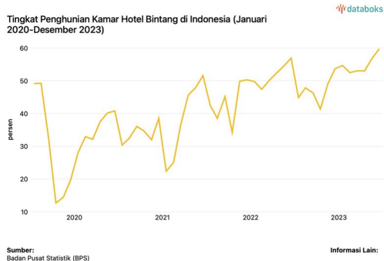
Gambar 1. 4 Data Tingkat Penghunian Kamar Hotel Bintang di Indonesia

bisnis perhotelan. Per Desember 2023 tercatat tingkat penghunian kamar (TPK) hotel berbintang di Indonesia mencapai 59,74%, berikut merupakan laporan dari Badan Pusat Statistik (BPS).