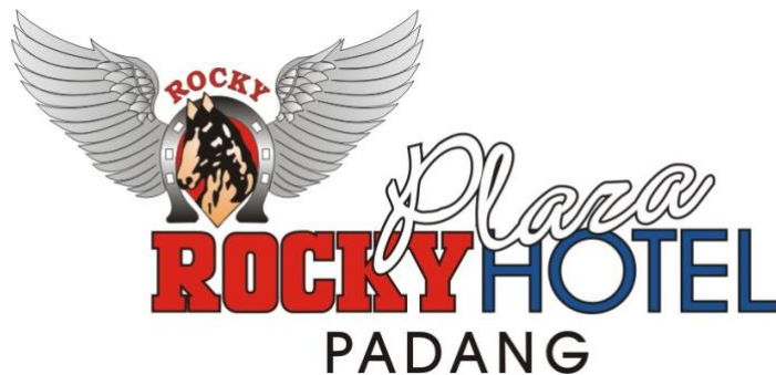
Gambar 1. 1 Logo Rocky Plaza Hotel Padang

Rocky Plaza Hotel Padang berlokasi di Jl. Permindo No. 40, Kp. Jao, Kec. Padang Barat, Kota Padang, Sumatera Barat, Indonesia. Rocky Plaza Hotel Padang adalah salah satu perusahaan perhotelan yang berpartisipasi dalam Perhimpunan Hotel Dan Restoran Indonesia (PHRI) dan berkontribusi pada perkembangan industri pariwisata dan perhotelan dengan cara ini. Rocky Plaza Hotel Padang saat ini menerima sertifikat "Bintang Empat". Berikut merupakan logo dari Rocky Plaza Hotel Padang: