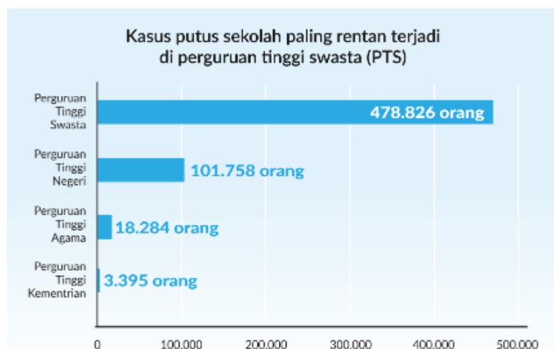
Gambar I.1 Jumlah drop out pada tahun 2020

Berdasarkan data yang diperoleh dari opendata.jabar.go.id pada tahun 2020 terdapat 8.483.213 mahasiswa yang terdaftar sebagai mahasiswa, namun dari jumlah mahasiswa yang terdaftar 602.208 mahasiswa memutuskan untuk berhenti kuliah yang dimana dari angka tersebut mayoritasnya berasal dari perguruan tinggi swasta dengan angka sebanyak 478.826 mahasiswa atau 79,5% dari total kasus mahasiswa yang berhenti kuliah, kemudian dari perguruan tinggi negeri (PTN) sebanyak 101.758 orang, 18.284 orang dari perguruan tinggi agama (PTA) dan sisanya 3.395 orang dari perguruan tinggi kedinasan (PTK). Pada Gambar I.1 menunjukkan tingkat kasus berhenti kuliah yang terjadi pada tahun 2020 yang dikutip dari opendata.jabarprov .