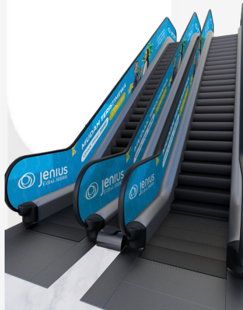
Gambar 4.16 Interest Ambient Media

Perancangan ambient media ini akan diletakkan di eskalator pada setiap mall di Kota Bandung yang terdapat booth mall Bank Jenius. Alasan dari penempatan ambient media tersebut yaitu agar menarik perhatian dari pengunjung yang melihat ambient media tersebut dan juga melihat booth mall Bank Jenius, sehingga pengunjung menjadi penasaran dengan apa yang sedang di iklankan dan mulai melirik produk Bank Jenius.