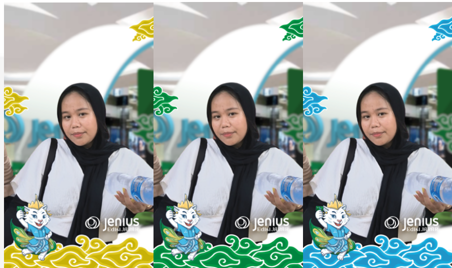
Gambar 4.23 Action Instagram Filter

Pada tahapan action ini, target audience yang ingin membuka rekening atau membuat kartu debit Bank Jenius sudah pasti mendatangi booth mall Bank Jenius, dan filter Instagram ini dapat digunakan oleh target audience yang ingin mengabadikan momen sekaligus mengunggahnya ke Instagram story dengan menggunakan filter Instagram ini. Penulis merancang desain filter dengan menggunakan 3 desain dengan warna – warna yang berbeda, yaitu kuning, hijau dan biru.