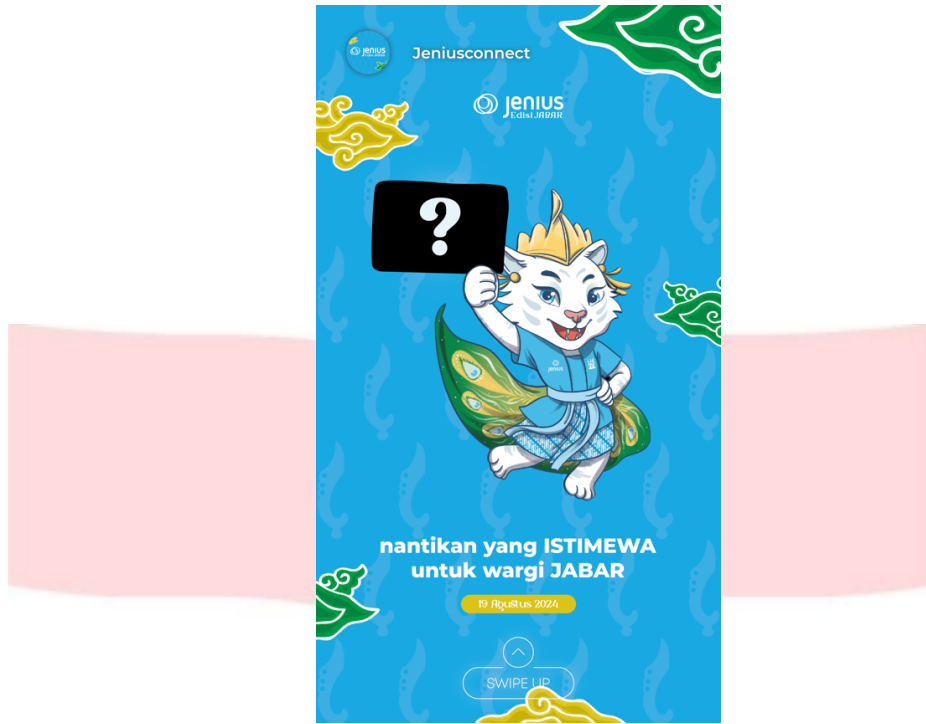
Gambar 4.10 Attention Instagram Story Ads