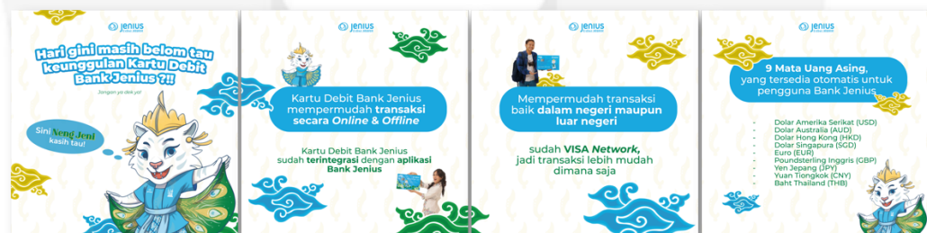
Gambar 4.18 Search Instagram Story Sumber : (Mudihardjo,2024)

Pada tahapan search ini, perancangan poster digital merupakan perancangan utamanya dan diletakkan pada Instagram Bank Jenius karena pada tahap ini diharapkan target audience sudah mencari tahu mengenai Bank Jenius ke akun Instagram dari Bank Jenius karena sudah diarahkan dari seluruh media pada tahapan attention dan Interes , lalu target audience pun sedang mencari tahu, mengenai kartu debit Bank Jenius edisi Jawa Barat dan fungsi-fungsi dari kartu debit Bank Jenius. Pada perancangan ini, penulis membuat perancangan 6 poster digital yang berisi mengenai apa itu kartu debit Bank Jenius, fungsi dan manfaat dari kartu debit Bank Jenius, desain dari kartu Bank Jenius edisi Jawa Barat, lalu info mengenai bagaimana cara mendapatkan kartu debit Bank Jenius edisi Jawa Barat dan juga manfaat apa saja yang didapatkan oleh pengguna yang baru saja membuat kartu debit Bank Jenius.