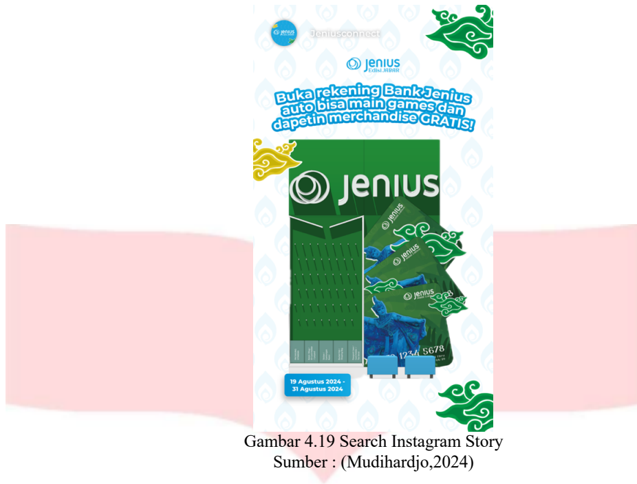
Gambar 4.19 Search Instagram Story

Selain membuat poster digital untuk Instagram feeds , penulis juga merancang poster digital untuk Instagram story yang berisi informasi seputar manfaat ketika target audience membuka rekening atau membuat kartu debit Bank Jenius.