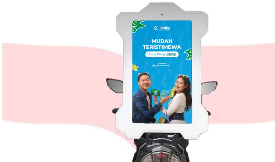
Gambar 4.15 Interest Ojek Ads

Pada tahap interest , penulis merancang poster untuk Ojek Ads guna menjangkau pekerja kantoran, mahasiswa, dan audiens lebih luas. Ojek Ads mendukung media lain dengan menyampaikan pesan secara langsung, seperti kepada pekerja yang melihatnya saat terjebak macet..