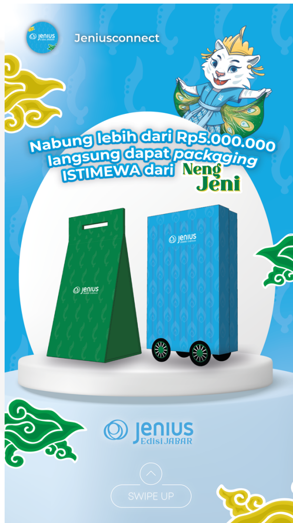
Gambar 4.24 Action Instagram Feeds

Pada tahap action , poster digital dirancang untuk mengingatkan target audience agar membuat kartu debit Bank Jenius edisi Jawa Barat. Poster ini juga mempersuasi mereka yang awalnya tidak tertarik, dengan menekankan edisi terbatas yang hanya tersedia dari 19 hingga 31 Agustus 2024, serta mengajak mereka mengunjungi booth di mall Bank Jenius.