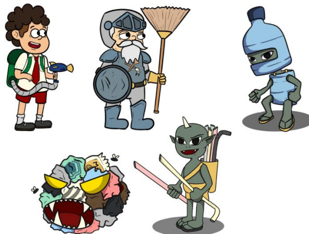
Gambar 2 Desain Karakter Game Plastic Monster Trash