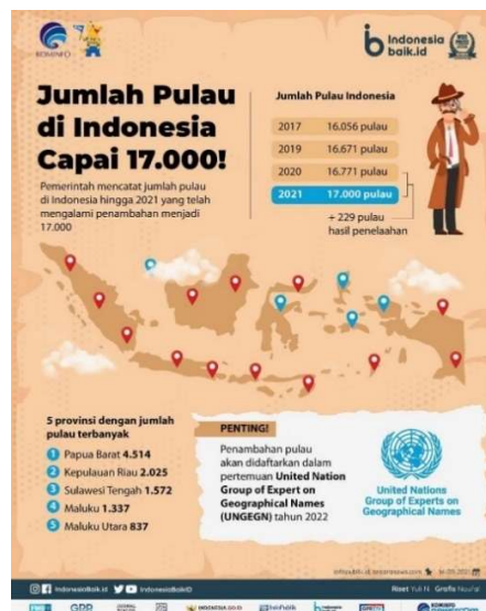
Gambar 1. 1 Jumlah Pulau di Indonesia

Indonesia merupakan negara kepulauan di Asia Tenggara yang dilintasi oleh garis khatulistiwa dan berada di antara Samudera Hindia dan Samudera Pasifik serta diantara Benua Asia dan Benua Australia, secara astronomis Indonesia terletak di 6° LU (Lintang Utara) – 11° LS (Lintang Selatan) dan 95° BT (Bujur Timur) – 141° BT (Bujur Timur). BPS melansir bahwa Indonesia memiliki luas daratan dan lautan mencapai 1.916.906,77 kilometer persegi yang menjadikannya negara terluas ke-14 di dunia. BPS menyatakan bahwa pada tahun 2022 Indonesia memiliki populasi yang besar, yaitu sebanyak 275 773,8 juta jiwa dan bertambah menjadi 278 696,2 juta jiwa pada 2023. Populasi ini terdiri dari berbagai suku, agama, dan budaya yang berbeda. Hal ini menjadikan Indonesia sebagai negara yang multikultural.