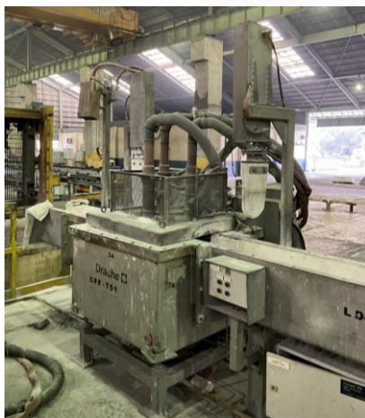
Gambar III. 2 Sistematika Penelitian

Data penelitian diambil dari mesin SIR-751. Dalam proses produksi aluminium billet, mesin SIR-751 berperan sebagai Gas Exhaust System, yaitu bagian dari proses yang mengeluarkan gas pengotor dari aluminium cair. Dapat