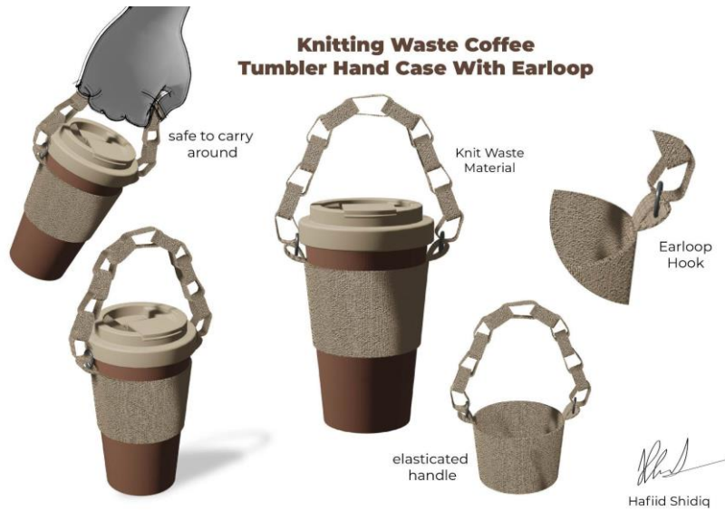
Gambar 2 Sketsa Terpilih

Kemudian penulis mencoba untuk membuat produk Hand Case Tumbler Coffee dengan menggunakan teknik pengolahan jahit klip kain elastis dengan bahan limbah potongan kain rajut hasil sisa produksi Kampoeng Radjoet.