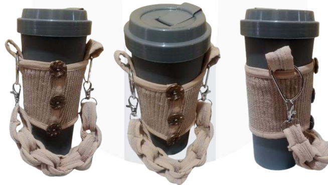
Gambar 3 Hasil Pembuatan Hand Case Tumbler Coffee