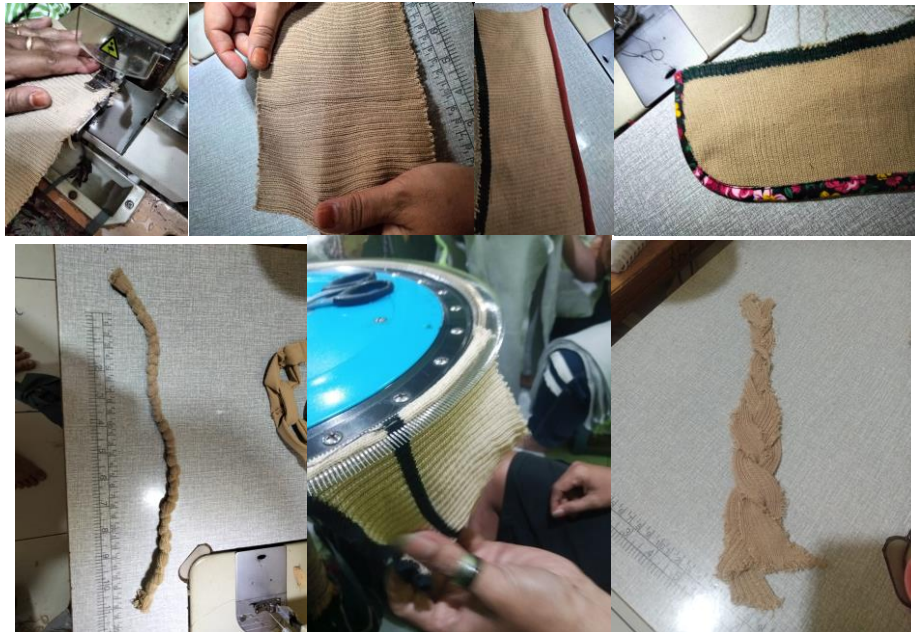
Gambar 1 Eksplorasi Limbah Potongan Kain Rajut Hasil Sisa Produksi Kampoeng Radjoet sumber: dokumentasi penulis

Dari hasil eksplorasi di atas dapat disimpulkan bahwa saat limbah potongan kain rajut rib/jalur dihubungkan dengan di jahit biasa tidak terlihat jahitan dan memungkinkan untuk menghubungkan pola dan menambah dimensi dari limbahnya namun saat diregangkan akan terlihat sedikit garis sambungan. Kemudian dari hasil teknik jahit obras, tepi dari limbahnya menjadi rapi dan tidak lagi terlihat benang-benang yang keluar, namun terlihat sedikit bergelombang karena dari sifat kain rajut yang elastis dan menghasilkan limbah-limbah yang baru. Saat dicoba menggunakan teknik klip dengan kain elastis bahan kringkel, limbah potongan kain rajut rib/ jalur tepiannya menjadi rapi namun keelastisan pada tepiannya berkurang sedikit namun mengatasi solusi dari karakteristik rajut yang labil saat dijahit. Pada teknik serong menggunakan kain katun tepiannya menjadi rapi namun keelastisannya jadi sedikit namun juga mengatasi solusi dari karakteristik rajut yang labil saat dijahit. Kemudian mencoba menggunakan teknik lilit dengan menggunakan benang jahit melilitkan limbah potongan kain rajutnya menjadi seperti tali. Benang-benang pada tepiannya tidak