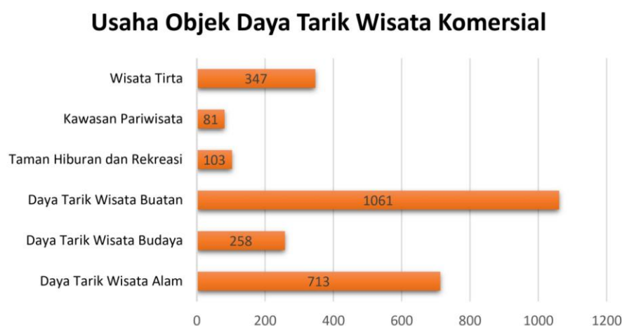
Gambar I.2 Jumlah Usaha Objek Daya Tarik Wisata Komersial

Menurut Sudjana dkk., (2021), pemilihan objek wisata pasca pandemi dipengaruhi oleh beberapa faktor, seperti keinginan untuk pengalaman baru, relaksasi, eksplorasi alam, dan kelezatan kuliner. Pemerintah dan pemangku kepentingan pariwisata dapat fokus meningkatkan kualitas fasilitas dan infrastruktur di tujuan wisata populer untuk memenuhi permintaan yang meningkat. Badan Pusat Statistik juga turut mencatat perkembangan terhadap jumlah usaha objek daya tarik wisata komersial menurut jenis usahanya pada tahun 2021 yang dapat diperhatikan pada gambar I.2.