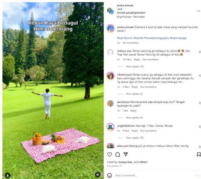
Gambar I.5 Video Instagram Tentang Destinasi Wisata di Bali

Twitter dan Instagram adalah dua platform media sosial yang sering digunakan oleh masyarakat untuk berbagi pendapat dan pengalaman mereka tentang objek wisata. Melalui keterangan dan tagar ( hashtag ), pengguna Instagram dan Twitter dapat mengekspresikan pendapat mereka tentang pengalaman selama kunjungan wisata, serta dapat mengomentari ulasan, foto, atau video yang dibagikan pengguna lain. Melalui ulasan yang diberikan oleh wisatawan, pengelola dapat memantau kepuasan pelanggan dan mengidentifikasi area-area yang memerlukan perbaikan. Berikut merupakan contoh ulasan masyarakat melalui media sosial Instagram yang dapat dilihat pada gambar I.4.