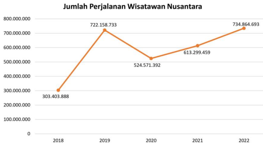
Gambar I.1 Jumlah Perjalanan Wisatawan Nusantara 2018-2022