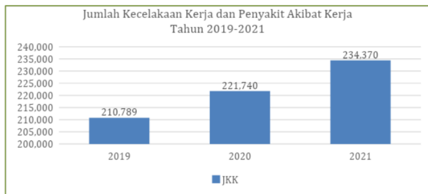
Gambar I.1 Jumlah Kecelakaan Kerja dan Penyakit Akibat Kerja di Indonesia (2019-2021) (BPJS Ketenagakerjaan, 2021)

Pekerjaan las adalah salah satu pekerjaan di industri informal yang memiliki potensi yang tinggi mengalami keluhan terhadap penglihatan yang berada pada urutan kedua pada kasus cedera pada mata yang terjadi terhadap pekerja. Berdasarkan data BPJS Ketenagakerjaan, kecelakaan kerja dan penyakit akibat kerja di Indonesia mengalami peningkatan jumlah kasus yang tinggi dari tahun 2019 ke tahun 2020, yaitu dari 210.789 kasus menjadi 221.740 kasus. Pada tahun 2020 ke tahun 2021, jumlah kasus kecelakaan kerja dan penyakit akibat kerja mengalami peningkatan sebesar 12.630 kasus. Berdasarkan data tersebut, kasus kecelakaan kerja dan penyakit akibat kerja menunjukkan Upward Trend setiap tahunnya (BPJS Ketenagakerjaan, 2021), Yang mana ditunjukkan pada Gambar I.1