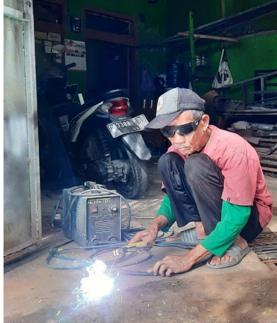
Gambar I.3 Kacamata Eksisting yang digunakan operator las

kondisi safety goggles yang tersedia di pasaran saat ini memiliki beberapa kelemahan yang signifikan, sehingga memunculkan kebutuhan untuk merancang ulang produk yang lebih baik dan sesuai dengan kebutuhan operator. Safety goggles yang beredar saat ini umumnya dirancang untuk berbagai keperluan industri, namun tidak semuanya dirancang secara khusus untuk memenuhi kebutuhan operator las. Berikut adalah beberapa kelemahan dari safety goggles yang ada di pasaran: