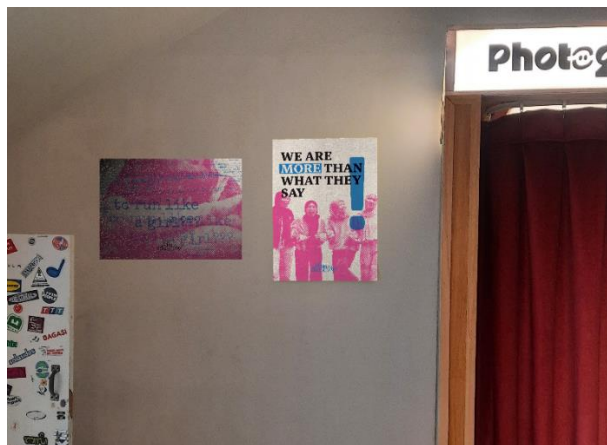
Gambar 8 Poster