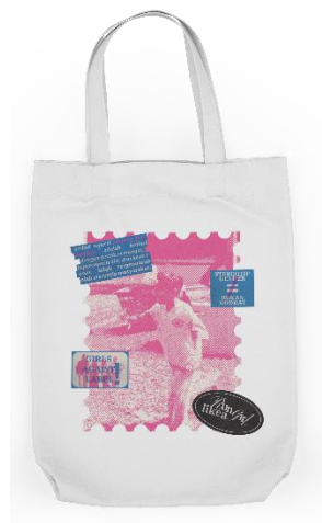
Gambar 5 Totebag