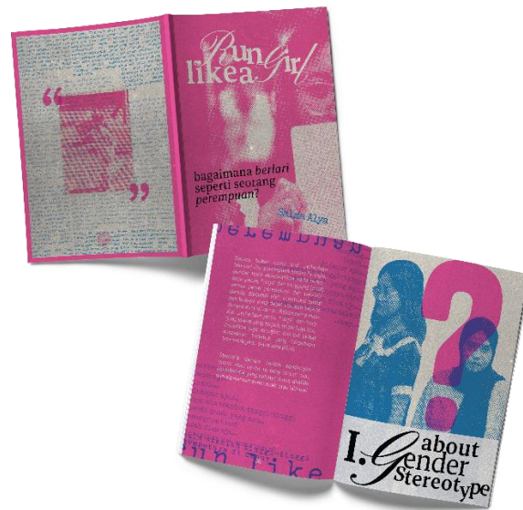
Gambar 5 Zine

Nama Penulis Utama, Nama Penulis Pendamping, Nama Penulis Pendamping JUDUL ARTIKEL TIDAK LEBIH DARI 15 KATA, 1 - 20