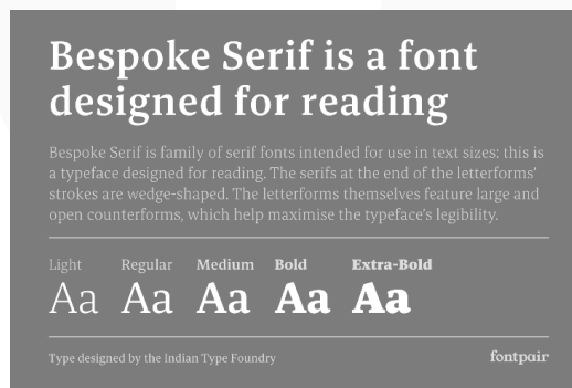
Gambar 3 Bespoke Serif

Pada perancangan zine ini menggunakan font Bespoke Serif sebagai headline dan font supreme sebagai body text, font Bespoke Seruf dipilih karena font ini memiliki tingkat keterbacaan yang tinggi, sedangkan font supreme dipilih sebagai body text karena font ini mudah dibaca, sehingga jika dipakai untuk teks yang banyak tidak terlihat jenuh.