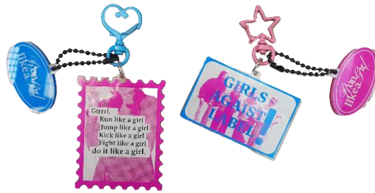
Gambar 9 Gantungan Kunci