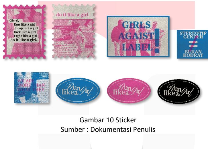
Gambar 10 Sticker