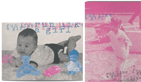
Gambar 7 Postcard