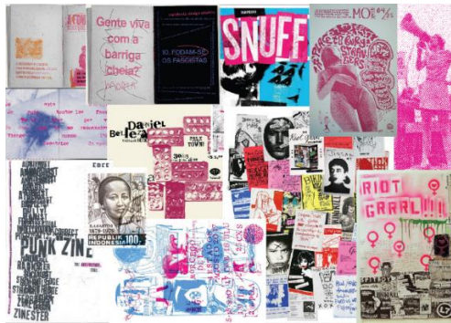
Gambar 2 Moodboard

Untuk memudahkan dalam perancangan dibuatlah moodboard untuk membantu merancang media informasi atau zine yang tepat.