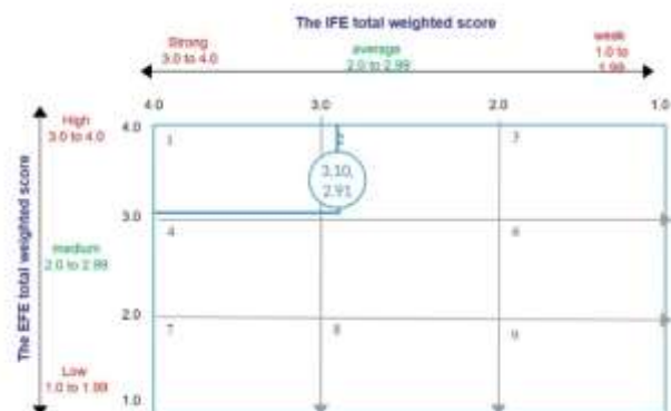
GAMBAR 2. Matriks IE

Hasil gabungan matriks IFE dan EFE membentuk Matriks IE, yang menunjukkan kombinasi total dari bobot kedua matriks. Matriks IE dimaksudkan untuk merumuskan strategi bisnis pada tingkat yang lebih detail. Seperti diperlihatkan pada Gambar 2, Matriks IE menunjukkan posisi perusahaan berada pada sel 2 yang mengindikasikan kebutuhan untuk menerapkan strategi Grow and Build .