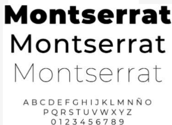
Gambar 4 Tipografi

Jenis tipografi yang akan penulis gunakan dalam materi promosi Good Mood adalah jenis tipografi sans serif. Tipografi sans serif memiliki karakteristik sederhana dan mudah untuk dibaca. Sans serif akan diterapkan pada media promosi dari Good Mood.