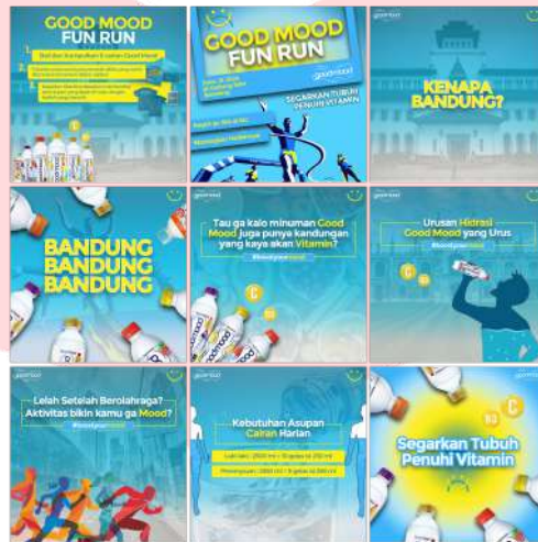
Gambar 8 Media dan Visual Search