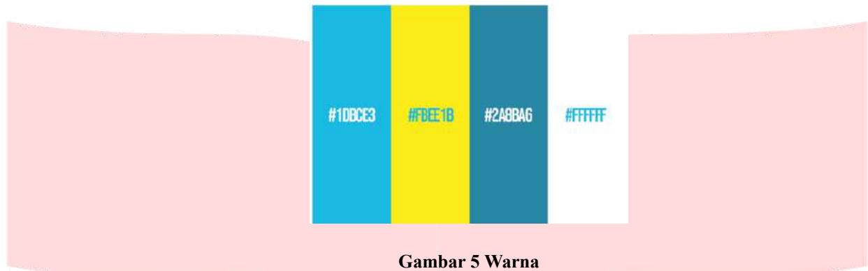
Gambar 5 Warna