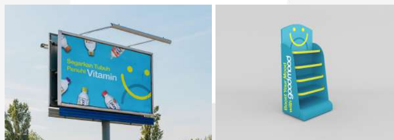
Gambar 6 Media dan Visual Attention

Strategi yang dilakukan oleh penulis adalah menarik perhatian target audiens. Hal ini dapat dilakukan melalui iklan, konten menarik, serta elemen kreatifnya yang dapat membuat orang tertarik hingga berhenti sejenak untuk melihat apa yang ditawarkan. (yang memberikan informasi singkat dan padat mengenai produk). Attention akan dilakukan melalui media poster , neon box , feeds instagram, billboard dengan strategi visual menarik, poster akan