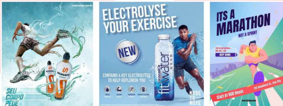
Gambar 3 Referensi Visual

foto produk, menggunakan background cerah dengan aset visual yang sederhana.