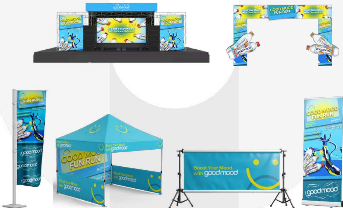
Gambar 9 Media dan Visual Main Event