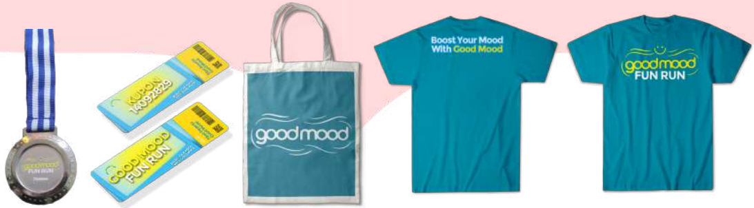
Gambar 10 Media dan Visual Merchandise