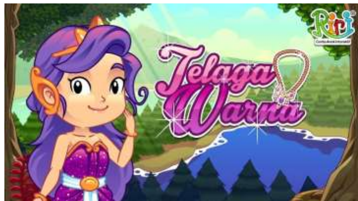
Gambar 1 | Kisah Telaga Warna | Dongeng Anak Bahasa Indonesia Sebelum Tidur | Cerita Rakyat Dongeng Nusantara

Animasi sendiri tidak bisa lepas dari jobdesk yang berperan dalam pembuatan animasi. Salah satu jobdesk ditujukan untuk background artist. Tujuan penulis sebagai background artist adalah membuat background lingkungan yang digunakan dalam animasi. background animasi tersebut bertujuan untuk mencerminkan lokasi, wilayah, dan suasana Indonesia saat itu. Dalam cerita legendaris ini penulis fokus membuat latar, mulai dari lingkungan sekitar danau, lingkungan kerajaan, lingkungan hutan Indonesia sesuai dengan zaman cerita tersebut diangkat.