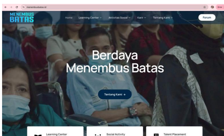
Gambar 1.1 Laman Website Menembus Batas

diberikan secara berkala dalam rentang waktu yang ditentukan oleh penyelenggara sampai akhirnya para difabel mendapatkan sertifikat tanda bahwa mereka memenuhi standar yang ditetapkan oleh Menembus Batas. Menembus Batas menggunakan platform online untuk menunjang segala bentuk pemberian informasi juga promosi, diantaranya menyediakan layanan daring berupa website yang dapat membantu memudahkan para difabel mengakses informasi dari Menembus Batas.