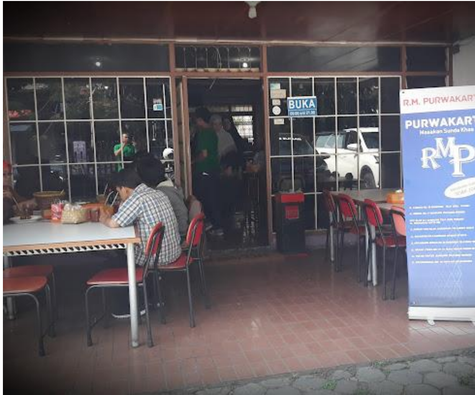
Gambar I. 2 Tampilan Depan Rumah Makan Purwakarta Cabang Arcamanik Endah