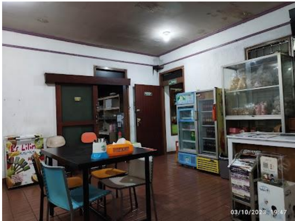
Gambar I. 3 Tampilan di dalam Rumah Makan Purwakarta Cabang Arcamanik Endah