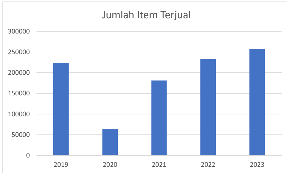
Gambar I. 5 Rata-rata Jumlah Produk Makanan dan Minuman Terjual RM Purwakarta

Berdasarkan grafik di atas, dapat disimpulkan bahwa jumlah item terjual berupa makanan dan minuman mengalami tren peningkatan yang hampir sama dengan jumlah pendapatan kotor cabang RM Purwakarta Arcamanik Endah. Berdasarkan hasil observasi dengan pemilik Rumah Makan Purwakarta, ibu pemilik RM Purwakarta merasa sudah cukup mendirikan 6 cabang di Kota Bandung dan ingin mengambil potensi usaha rumah makan khas daerah di luar daerah Bandung dan memilih Cimahi sebagai alternatif terkuat wilayah pembukaan cabang baru.