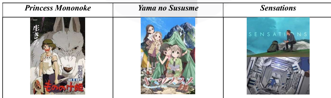
Tabel 1. Analisis tiga karya

Setiap karya yang telah dianalisis akan kemudian dijadikan referensi dalam konsep perancangan karya. Analisis dilakukan pada beberapa tiga karya animasi yaitu “ Princess Mononoke ”,