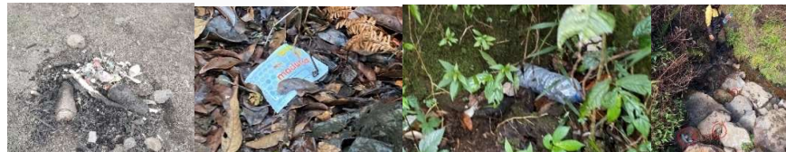
Gambar 2. Pencemaran lingkungan pada pos-pos pendakian Jalur Gunung Putri