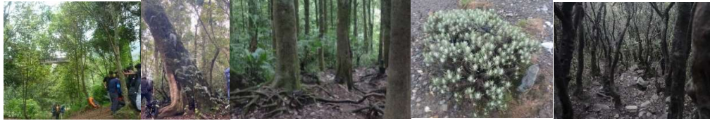
Gambar 3. Pencemaran lingkungan pada pos-pos pendakian Jalur Gunung Putri