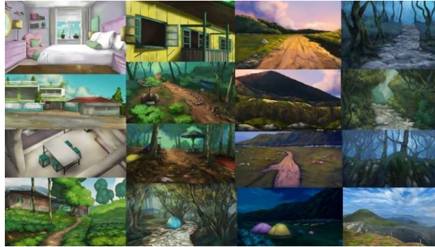
Gambar 6. Tahap Pewarnaan

Proses tahap terakhir merupakan pewarnaan yang dilakukan dengan pengayaan secara semi realis, digunakan warna-warna yang sesuai dengan mood yang ingin disampaikan pada scene tersebut. Pemberian warna diawali dengan memberikan warna dasar atau blocking warna, lalu disusul dengan pemberian detail warna terhadap objek-objek yang ada. Setelahnya diberikan pencahayaan dan bayangan terhadap objek-objek yang ada. Adapun beberapa pewarnaan background yang sudah dibuat untuk perancangan background sebagai berikut: