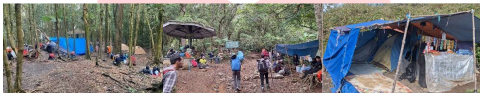
Gambar 1. Kondisi area pos pendakian Gunung Gede-Pangrango Jalur Gunung Putri