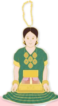
Gambar 7 Gantungan Kunci