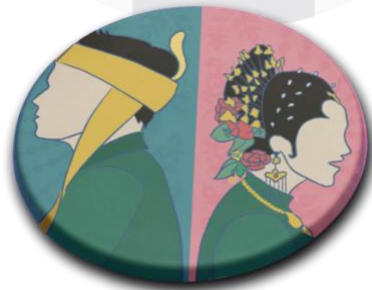
Gambar 7 Cermin