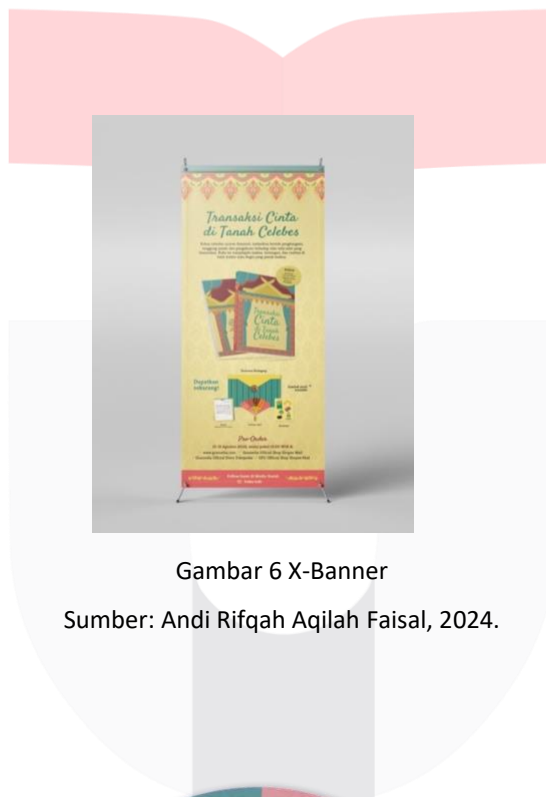
Gambar 6 X-Banner