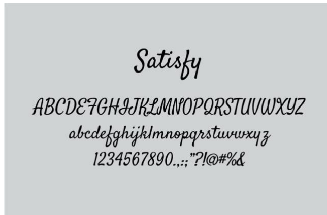
Gambar 1 Font untuk headline