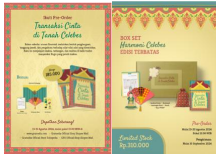
Gambar 5 Poster