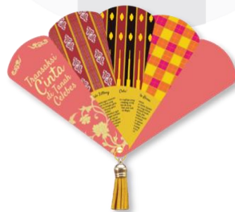
Gambar 8 Bookmark