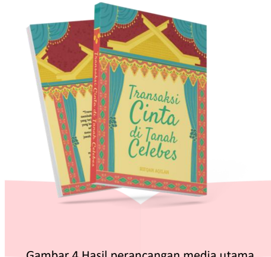
Gambar 4 Hasil perancangan media utama