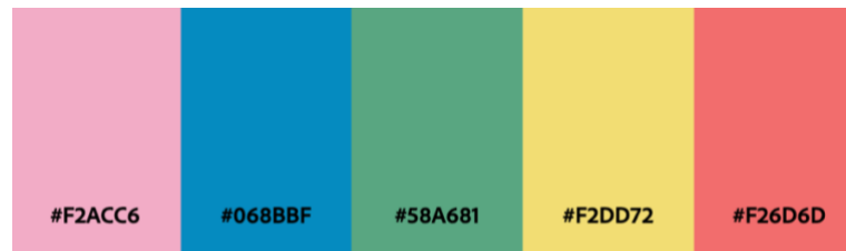
Gambar 3 Color palette