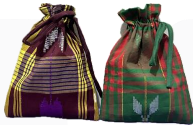
Gambar 8 Pouch