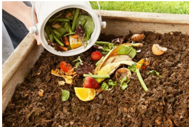
Gambar 1. 2 Kompos Organik

Dengan adanya permasalahan tersebut sampah organik dapat dimanfaatkan dan diolah menjadi pupuk kompos cair dan padat. Kompos merupakan pupuk organik yang terurai secara lambat, namun dapat merangsang kehidupan tanah serta memperbaiki struktur tanah. Kompos sebagai salah satu contoh pupuk organik sangat baik dan bermanfaat untuk segala jenis tanaman, mulai dari tanaman hias, sayuran, buah-buahan, tanaman pangan, hingga tanaman perkebunan (Sundarta et al., 2018).