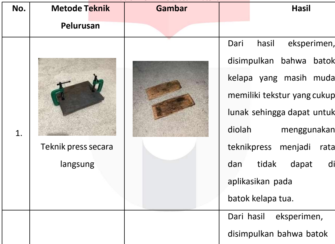
Table 4 Teknik Pelurusan Material

Dalam tahap awal proses eksperimen pada material untuk menjadi datar (lurus) bertujuan mengetahui karakter sifat dan bentuk batok kelapa secara langsung agar dapat dilakukan proses pemotongan laser cutting , dengan menggunakan beberapa teknik yang akan di jelaskan di tabel berikut :