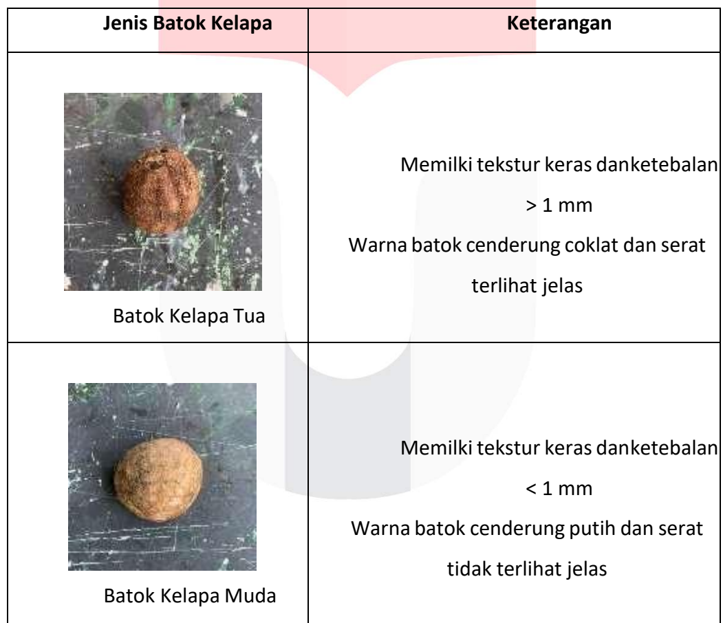
Table 1 Jenis Batok Kelapa

Dalam perancangan ini, penulis mengambil beberapa referensi dari penelitian sebelumnya tentang eksplorasi material pada batok kelapa untuk bertujuan mengetahui karakter sifat tempurung kelapa secara langsung serta batasan-batasan dalam berbagai kemungkinan teknik pemanfaatannya. Tujuan dari analisis material ini adalah untuk mengetahui peluang atau value dari batok kelapa sehingga dapat dimanfaatkan secara maksimal. Cara yang dilakukan yaitu dengan menentukan perlakuan terbaik, cepat, dan tepat untuk pemanfaatan batok kelapa.