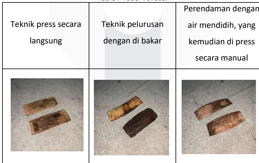
Table 7 Tabel Validasi

Setelah melakukan eksplorasi, dilakukan validasi akhir secara langsung pada operator laser cutting tentang kemudahan dan efisiensi material dalam pengolahan lasercutting .