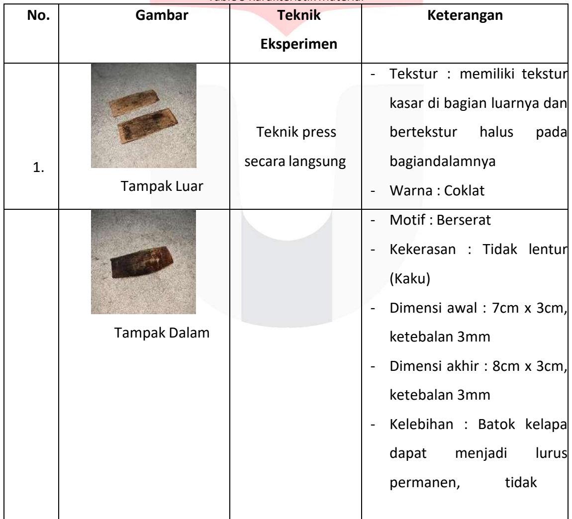
Table 5 Karakteristik Material

Setelah melalui tahap eksperimen pelurusan (datar) dengan menggunakan beberapateknik, maka diperoleh data tentang karakteristik batok kelapa sebagai berikut :