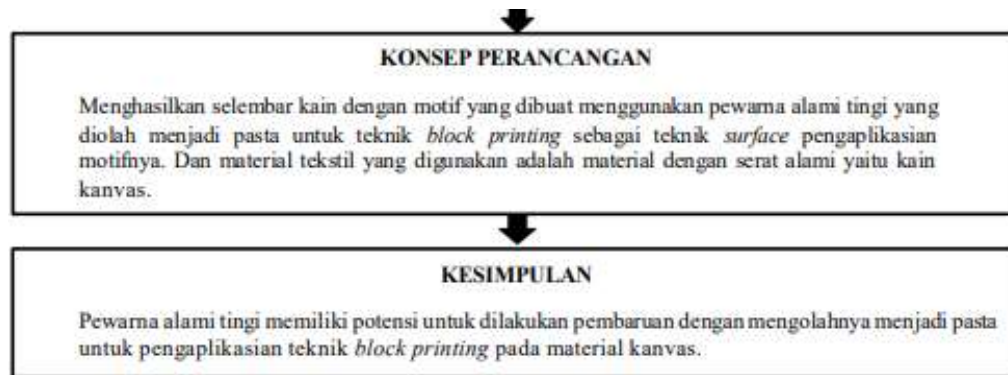
Bagan I.1 Kerangka Penelitian