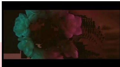
Gambar 7 Teknik Data Mosh

Data Mosh merupakan sebuah Teknik editing yang akan merusak video menjadi pecah pecah, Teknik ini digunakan sebagai konsep visual untuk merepresentasikan androgini. Data Mosh digunakan sebagai pengartian salah paham Masyarakat terhadap androgini.