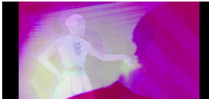
Gambar 3: Gerakan "Pugeran" Tari Puja

Pada gambar 14 nampak gerakan "Nyawang" dari tari Puja yang menunjukkan kelembutan serta gerakan tangan yang halus, gerakan ini merupakan representasi dari feminim yang cenderung lembut.