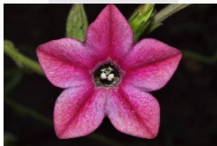
Gambar 1 Contoh Gambar asset Mapping

Pada tahap Pra – Produksi penulis juga menyiapkan beberapa elemen asset digital yang digunakan untuk mapping pada proyektor