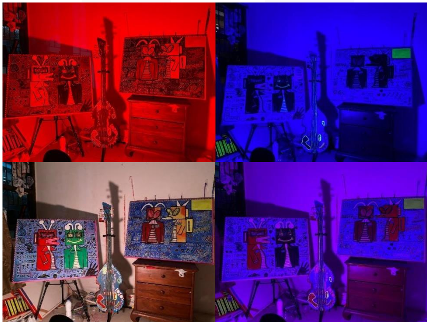
Gambar 3. Proses percobaan lampu ke kanvas Beatlee Bassman

Selanjutnya, penulis mulai tahap proses pengkaryaan kedalam media kanvas, Setelah semua persiapan melukis seperti pemantapan ide, konsep, gaya, sketsa, media, alat, bahan dan teknik sudah terpenuhi, penulis memulai eksekusi karya sebelum melanjutkan ke tahap produksi memperinci desain dan struktur karya.