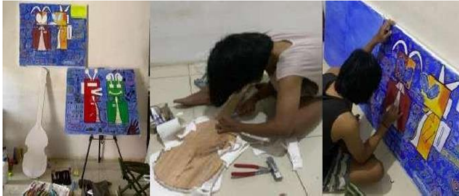
Gambar 2. Eksekusi Sketsa Karya

Langkah pertama, penulis, membuat sketsa pada sketchbook sebagai panduan untuk media objek, dan penataan karya Seni Lukis.