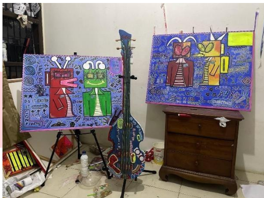
Gambar 4. Karya final Beatlee Bassman Sumber: Penulis, 2024

penafsiran hubungan antara warna dan emosi bisa berbeda-beda bergantung pada perspektif individu serta konteks musik atau karya seni yang ingin diungkapkan, namun dengan mendalami keterkaitan antara warna dan emosi, penulis mampu menghasilkan karya- karya yang lebih ekspresif dan menyentuh perasaan audiens , atau penikmat seni.