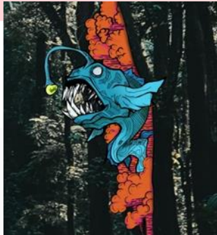
Gambar 5 Pewarnaan gambar ikan (2024)