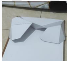
Gambar 3 Penempelan Geometri Ke Base (2024)