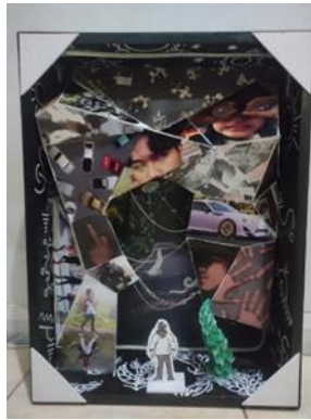
Gambar 8 Hasil Karya 1 (2024)