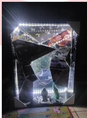
Gambar 9 Hasil Karya 2 (2024)