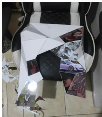
Gambar 6 Proses penggabungan (2024)