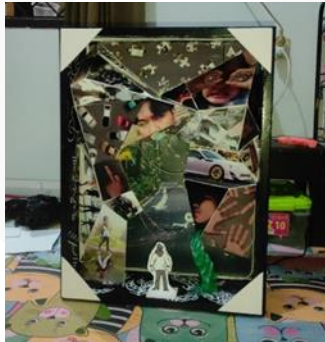
Gambar 7 Proses merakit semua elemen (2024)