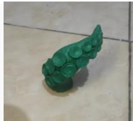
Gambar 2 Proses Awal Tentakel (2024)