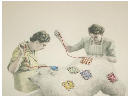
Gambar 1.1 Patchwork

Salah satu seniman yang turut menyuarakan kepeduliannya akan lingkungan adalah Toni Hamel. Beberapa karya yang dihasilkan oleh seniman asal toronto ini banyak mengangkat isu mengenai kerusakan lingkungan serta kesejahteraan hewan atau eksploitasi hewan. Karyanya yang berjudul Patchwork merupakan salah satu karyanya yang mengangkat isu mengenai eksploitasi hewan yang dijadikan sebagai bahan pernak pernik oleh manusia. (Smith, 2017)