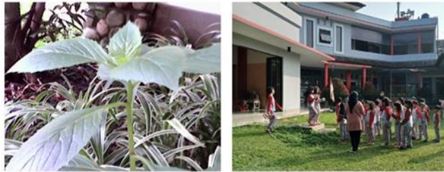
Gambar 4. Foto yang berfokus pada satu objek diambil oleh anak (kiri) dan keseluruhan tempat diambil oleh penulis (kanan).

bayangan yang lebih panjang. Faktor alam terlihat dari beberapa anak yang hanya menggunakan sandal terbuka, memungkinkan mereka untuk terkena rerumputan.