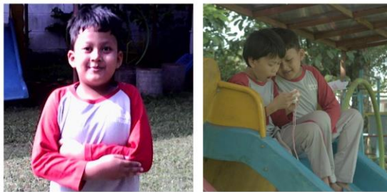
Gambar 2. Foto objek manusia yang diambil oleh anak (kiri) dan penulis (kanan).

Sesuai dengan kesimpulan yang diambil, penulis membandingkannya dengan foto-foto yang diambil sendiri oleh penulis. Pada kesimpulan pertama penulis menggunakan foto pada Gambar 2 sebagai pembandingan. Pada Gambar 2, terlihat dua foto objek manusia yang diambil oleh anak (foto kiri) dan dewasa (foto kanan). Pada objek kiri terlihat subjek memperlihatkan senyum. Hal ini bisa disebabkan oleh arahan anak yang mengambil gambar yang meminta temannya untuk tersenyum ke arah kamera. Pada objek kanan tidak terlihat subjek memperlihatkan senyum. Foto yang diambil lebih berfokus kepada ekspresi dan aktivitas yang dilakukan objek. Foto pertama memperlihatkan dua orang anak yang asyik memainkan kamera di atas perosotan, di mana anak yang memegang kamera terlihat terkejut sementara yang di sebelahnya tampak penasaran.