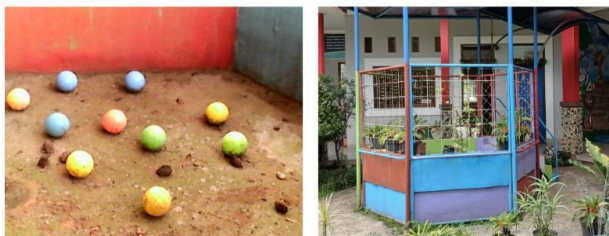
Gambar 3. Foto objek sekolah yang diambil anak (kiri) dan penulis (kanan).

tempat yang kotor terkena tanah, sementara foto sebelah kanan terlihat gazebo yang dikelilingi tanaman. Sekilas tidak tampak benang merah antara kedua foto tersebut. Namun penulis yang sudah berkunjung ke TK Telkom Bandung langsung mengetahui bahwa bola-bola tersebut terletak di dalam gazebo.