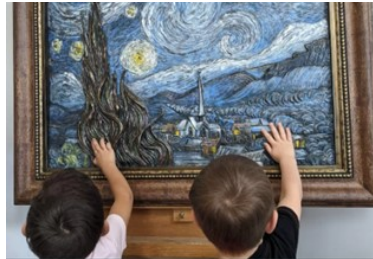
Gambar 1. 2 “ Starry Night ” by Thomas Bustos

Pada tahun 1928, Philadelphia Museum of Art (PMA) menjadi contoh bagaimana seni dapat dinikmati oleh semua orang, termasuk mereka yang tidak dapat melihat. Mulai dari interpretasi sentuhan terhadap lukisan hingga program manajemen aksesibilitas. Seperti memberikan tur untuk tunanetra, didampingi oleh pemandu dari sukarelawan yang memberikan informasi tentang objek secara fisik tentang karya seni (Thoma, 2013).