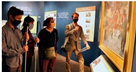
Gambar 1. 1Museum of the American Revolution in Philadelphia

Disabilitas tunanetra adalah suatu kondisi dengan kehilangan kemampuan penglihatan. Ini merupakan pengalaman hidup yang unik dengan tantangan dan keistimewaannya tersendiri (Rahmah, 2019). Meskipun orang dengan penglihatan normal cenderung memandang dunia secara visual, namun ini bukanlah satu-satunya cara untuk merasakan keindahan dunia ini. Keterbatasan yang dialami oleh penyandang tunanetra menjadi tantangan dalam menciptakan karya seni rupa yang tidak hanya bergantung pada aspek visualnya saja, dengan memperluas pengalaman seni bagi penyandang disabilitas tunanetra dapat menikmatinya.