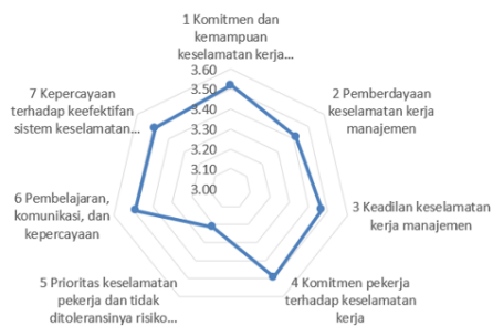
Gambar 3. 1 Diagram Radar NOSACQ-50

Secara keseluruhan PT. SBP memiliki nilai yang baik untuk hampir semua dimensinya karena nilai di atas 3.30, hanya pada dimensi 5 nilai dinyatakan cukup baik karena memiliki nilai dibawah 3.30. sehingga masih dibutuhkan perbaikan pada dimensi 5.