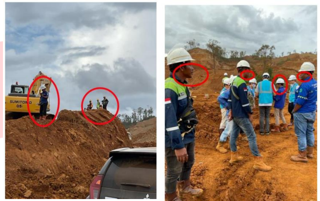
Gambar 3. 3 Tindakan tidak aman 1

Observasi dilakukan menggunakan tabel inspeksi keselamatan tambang yang mewakili dimensi 1, 4 dan 5. Inspeksi didapatkan dan dihitung menggunakan aplikasi safety culture . Masi terdapat beberapa tindakan dan kondisi berbahaya. Seperti jalanan yang licin, APD tidak lengkap, dan berdiri pada tempat yang tidak aman.