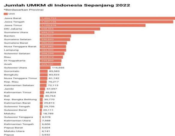
Gambar 1.1 Jumlah UMKM di Indonesia Periode 2022

Persaingan antar UMKM di Indonesia terus meningkat, seiring dengan pertumbuhan jumlah UMKM yang signifikan. Hal ini menyebabkan kontribusi UMKM terhadap perekonomian negara semakin besar. Menurut data Kementerian Koperasi dan UKM, jumlah UMKM di Indonesia saat ini mencapai 64,2 juta dengan kontribusi terhadap PDB sebesar 61,07 persen atau senilai 8.573,89 triliun rupiah. Kontribusi UMKM terhadap perekonomian Indonesia meliputi kemampuan menyerap lebih kurang 117 juta pekerja atau 97 persen dari total tenaga kerja yang ada, serta dapat menghimpun sampai 60,4 persen dari total investasi (data semester I tahun 2021) (Kementerian Keuangan RI, 2023). Kementerian Koperasi dan UKM (Kemenkop UKM), UMKM 2022 dan tercatat 9,11 juta usaha di Indonesia, yang terdiri dari 9,09 juta usaha mikro, kecil dan menengah (UMKM) dan 20 ribu koperasi (CNBC Indonesia, 2023). Berikut jumlah UMKM di Indonesia Periode 2022.