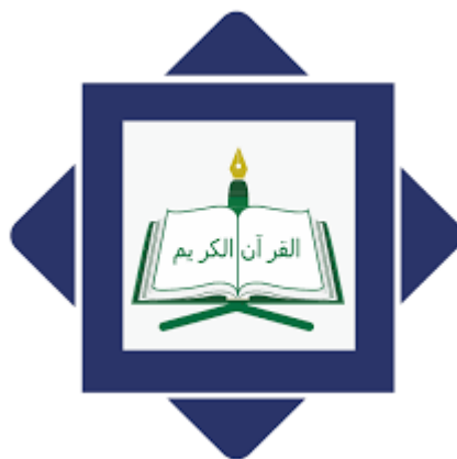
Gambar 1.2 Logo Perguruan Islam Ar-Risalah