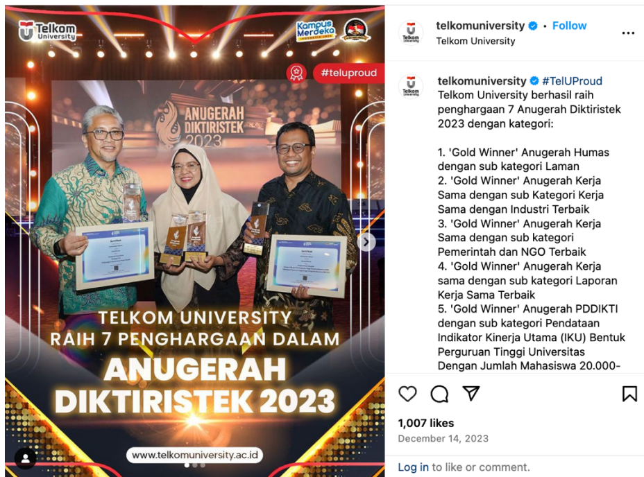
GAMBAR 1.3 TELKOM UNIVERSITY MERAHAI PENGHARGAAN DALAM ANUGERAH DIKTIRISTEK TAHUN 2023