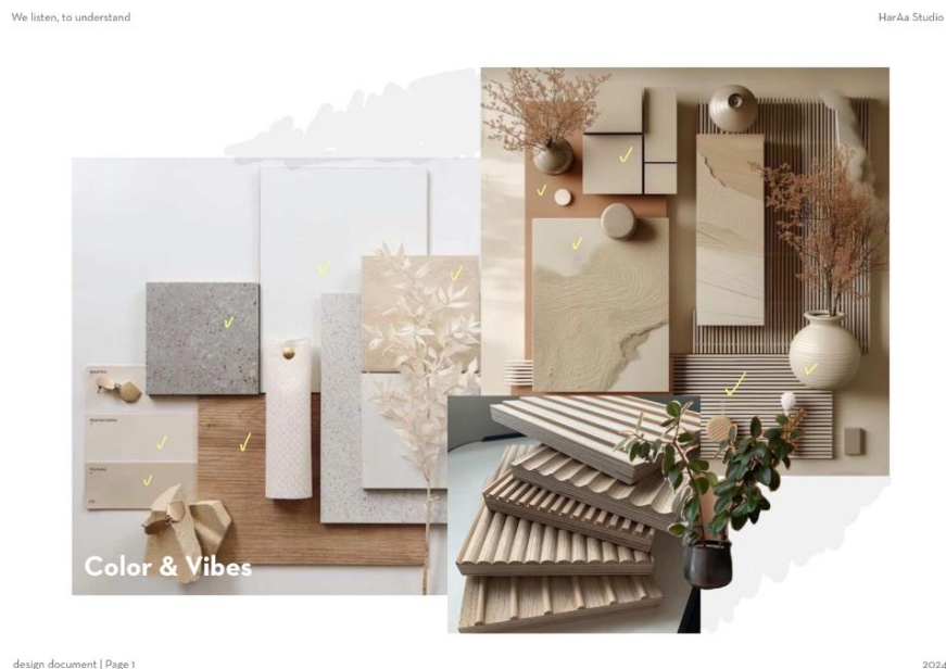
Gambar 1. 2 Moodboard untuk Home Office Gaya Japandi

Pembuatan moodboard didapatkan dari pinterest dengan kata kunci yang telah disesuaikan oleh kebutuhan dan keinginan klien. Pada perancangannya, Gaya japandi akan mendominasi seluruh ruangan yang ada. Selain itu juga pemilihan material dan warna didominasi oleh warna netral dan warna hangat yang diharapkan bisa melahirkan kesan homey .