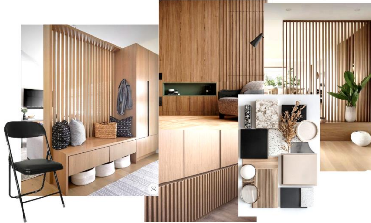
Gambar 1. 3 Moodboard untuk Perpustakaan SMKN 9 Bandung