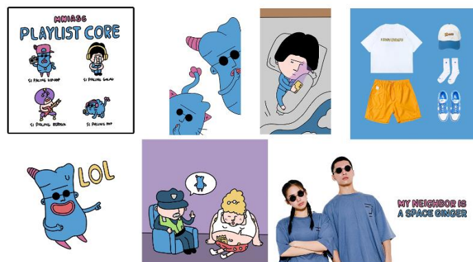
Gambar 3 Media Online

Kemudian, media utama yang digunakan didominasi oleh media online. Namun, ada beberapa media cetak yang menjadi media utama dan media pendukung.