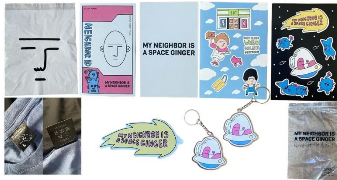
Gambar 4 Media Cetak