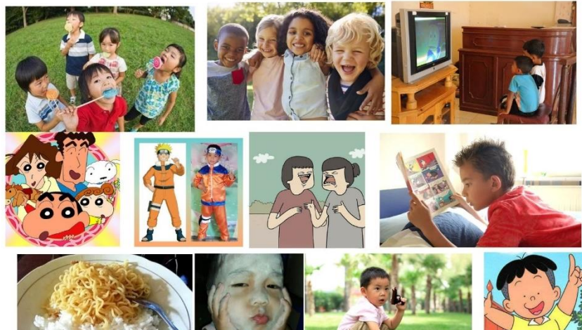
Gambar 2 Konsep Kreatif

lain dengan gestur tubuh yang absurd dan ekspresif yang bertujuan membangun childhood memory khalayak sehingga dapat membangun ikatan emosional antara brand dan khalayak sasaran.