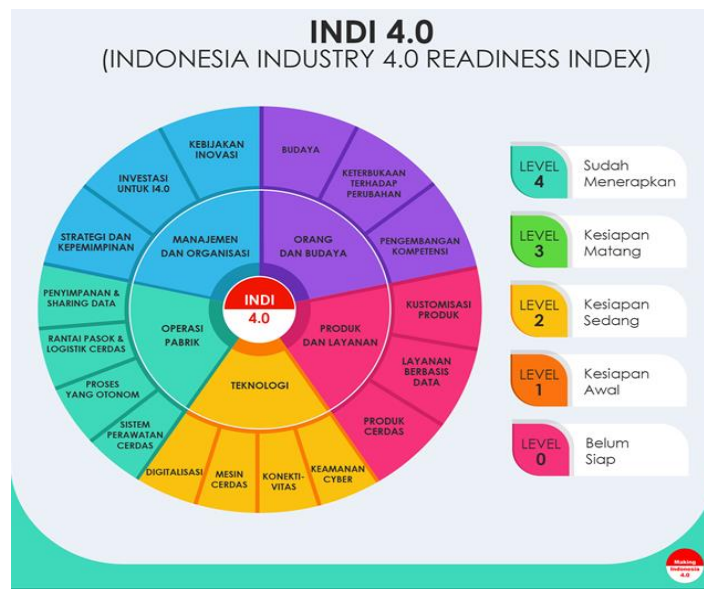
Gambar 1.3 Penilaian Tingkat Kesiapan Industri

Dalam mengukur kesiapan industri dengan INDI 4.0, digunakan metode asesmen yang mencakup survei daring yang diisi oleh pihak industri, kemudian dilanjutkan dengan verifikasi lapangan oleh para ahli. Rentang penilaian dalam INDI 4.0 terdiri dari level 0 hingga level 4. Level 0 menunjukkan bahwa industri belum siap untuk bertransformasi ke Industri 4.0. Level 1 menandakan industri berada pada tahap kesiapan awal, sementara level 2 menunjukkan kesiapan sedang. Level 3 mencerminkan industri yang telah mencapai kesiapan matang dalam transformasi menuju Industri 4.0, sedangkan level 4 menunjukkan bahwa industri telah menerapkan sebagian besar konsep Industri 4.0 dalam sistem produksinya. Selain terdapat metode asesmen dalam INDI 4.0 juga memiliki 5 pilar dan dibagi menjadi menjadi 17 bidang yang dijadikan acuan dalam mengukur kesiapan industri di Indonesia untuk bertransformasi menuju Industri 4.0. Bidang-bidang ini mencakup berbagai aspek strategis yang berperan dalam menentukan sejauh mana industri telah mengadopsi teknologi dan prinsip Industri 4.0 guna meningkatkan daya saing dan efisiensi operasional. Berikut merupakan visualisasi gambaran dari bidang dan pilar serta level penilaian dalam INDI 4.0: