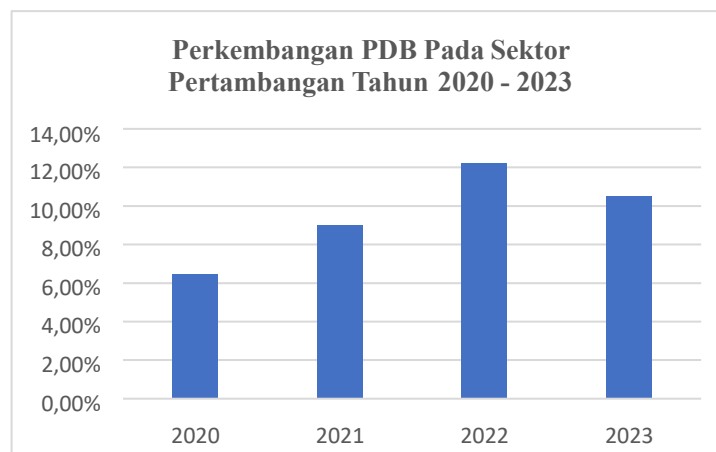
Gambar 1. 2 Perkembangan PDB Pada Sektor Pertambangan Tahun 2020-2023

Menurut BPS (Badan Pusat Statistik) Salah satu indikator penting untuk mengetahui kondisi ekonomi di suatu negara dalam suatu periode tertentu adalah data Produk Domestik Bruto (PDB), baik atas dasar harga berlaku maupun atas dasar harga konstan. Berikut adalah data perkembangan PDB pertambangan dimana sektor energi ikut serta dalam kontribusi perkembangan PDB tersebut tahun 2020-2023: