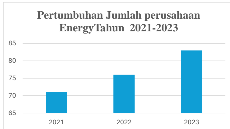
Gambar 1. 1 Pertumbuhan Jumlah Perusahaan Energy 2021-2023