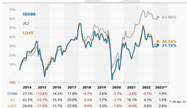
Gambar 1.1. Kinerja Saham IDX80 Tahun 2020-2023

Banyaknya saham yang terdaftar dalam bursa membuat investor perlu berhati-hati dalam memilih saham untuk berinvestasi. Oleh karena itu, Bursa Efek Indonesia menerbitkan indeks saham dengan kriteria-kriteria tertentu yang dapat dipilih investor. Salah satu indeks saham tersebut adalah Indeks IDX80. Menurut Bursa Efek Indonesia (2021), Indeks IDX80 merupakan indeks baru yang diterbitkan oleh Bursa Efek Indonesia secara resmi pada 1 Februari 2019. IDX-80 merupakan Indeks yang mengukur kinerja harga dari 80 saham yang memiliki likuiditas tinggi dan kapitalisasi pasar besar serta didukung oleh fundamental perusahaan yang baik ( www.idx.co.id ). Berikut ini kinerja saham IDX 80 Tahun 2020-2023: