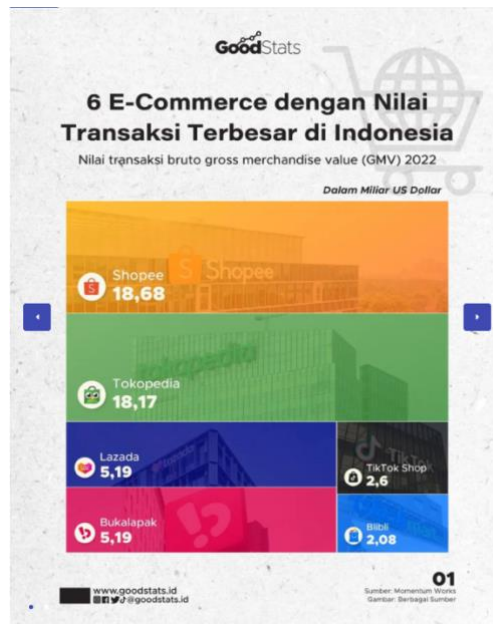
Gambar 1. 4 platform e-commerce dengan nilai transaksi terbesar di Indonesia pada tahun 2022

Hadiah berupa cashback, kupon diskon, dan koin yang dapat ditukarkan menjadi insentif bagi pengguna untuk lebih sering berinteraksi dengan aplikasi, bahkan ketika tidak memiliki niat untuk berbelanja.