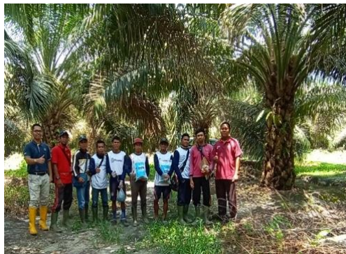
Gambar 1. 2 Karyawan PT. Dwi Adhiusaha

PT Dwi Mitra Adhiusaha (PT DMA) adalah perusahaan yang bergerak di bidang perkebunan dengan komoditas utama berupa produk hasil tanaman kelapa sawit. Berdiri sejak tahun 1996, PT Dwi Mitra Adhiusaha kini membawahi perkebunan kelapa sawit seluas 6.000 Ha yang terletak di Kalimantan Tengah dan Kalimantan Selatan beserta pabrik pengolahan kelapa sawit berkapasitas 30 ton/jam di Kalimantan Selatan. Dengan jumlah karyawan melebihi 1000 orang, PT Dwi Mitra Adhiusaha memiliki misi mengedepankan inovasi dan pengembangan sumber daya manusia untuk menjadi perusahaan yang lestari dan berkesinambungan. PT Dwi Mitra Adhiusaha (PT DMA) menaungi banyak perusahaan kelapa sawit sehingga dibutuhkan pengelolaan system manajemen yang baik untuk membuat kinerja lebih efektif.