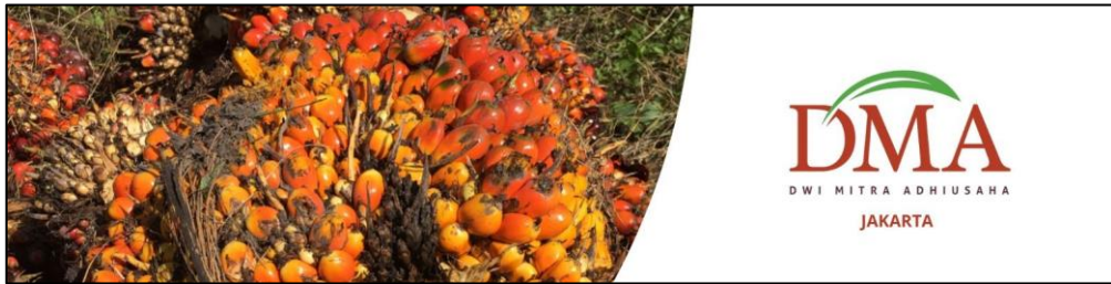
Gambar 1. 3 Tendan Buah Segar Kelapa Sawit

Perusahaan berfokus pada kegiatan usaha pada penanaman tanaman kelapa sawit dan pemanenan tendan buah segar (TBS) yang kemudian akan dijual kepada pabrik pengolahan kelapa sawit maupun distributor. Selain itu perusahaan ini juga melakukan kerjasama dengan dua koperasi dalam bentuk plasma. Perusahaan ini memiliki beberapa anak perusahaan yang bergerak diberbagai bidang seperti dibidang kelapa sawit yaitu PT. Candi Artha, bidang perkebunan mangga yaitu PT. Trigatra Rajasa dan bidang pertambangan yaitu PT. Pasirmaung Agritech.