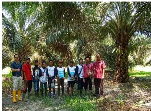
Gambar 1. 2 Karyawan PT. Dwi Adhiusaha

PT Dwi Mitra Adhiusaha (PT DMA) adalah perusahaan yang bergerak di bidang perkebunan dengan komoditas utama berupa produk hasil tanaman kelapa sawit. Berdiri sejak tahun 1996, PT Dwi Mitra Adhiusaha kini membawahi perkebunan kelapa sawit seluas 6.000 Ha yang terletak di Kalimantan Tengah dan Kalimantan Selatan beserta pabrik pengolahan kelapa sawit berkapasitas 30 ton/jam di Kalimantan Selatan. Dengan jumlah karyawan melebihi 1000 orang, PT Dwi Mitra Adhiusaha memiliki misi mengedepankan inovasi dan pengembangan sumber daya manusia untuk menjadi perusahaan yang lestari dan berkesinambungan. PT Dwi Mitra Adhiusaha (PT DMA) menaungi banyak perusahaan kelapa sawit sehingga dibutuhkan pengelolaan system manajemen yang baik untuk membuat kinerja lebih efektif.