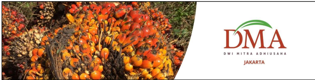
Gambar 1. 3 Tendan Buah Segar Kelapa Sawit

Perusahaan berfokus pada kegiatan usaha pada penanaman tanaman kelapa sawit dan pemanenan tendan buah segar (TBS) yang kemudian akan dijual kepada pabrik pengolahan kelapa sawit maupun distributor. Selain itu perusahaan ini juga melakukan kerjasama dengan dua koperasi dalam bentuk plasma. Perusahaan ini memiliki beberapa anak perusahaan yang bergerak diberbagai bidang seperti dibidang kelapa sawit yaitu PT. Candi Artha, bidang perkebunan mangga yaitu PT. Trigatra Rajasa dan bidang pertambangan yaitu PT. Pasirmaung Agritech.