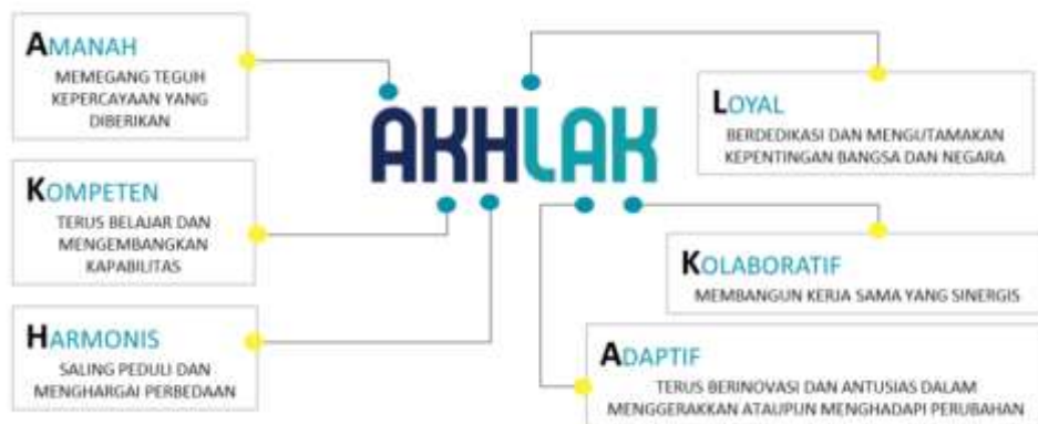
Gambar 1.2 Budaya Perusahaan