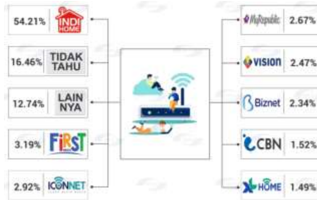
Gambar 1.7 Pangsa Pasar Operator Fixed Broad Band tahun 2023

Sejak diluncurkan pada Juni 2021, dalam waktu kurang dari empat tahun, jumlah pelanggan Iconnet tumbuh pesat hingga 800%, mencapai lebih dari 1 juta pelanggan pada akhir tahun 2023. Dengan pangsa pasar sebesar 2,92%, Iconnet berada di posisi ketiga setelah Indihome dan First Media, mengungguli beberapa pesaing lama seperti MyRepublic, Vision, Biznet, CBN, dan XL Home (APJII, 2023).