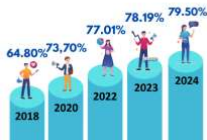
Gambar 1.6 Peningkatan Persentasi Penetrasi Internet di Indonesia 2018-2024 Sumber: APJII (2024)

Berdasarkan data yang dihimpun oleh APJII (2024:13), pada tahun 2024, penggunaan internet telah menembus ke berbagai lapisan masyarakat yang mana telah mencapai 221 juta jiwa atau setara dengan 79,50% dari total populasi Indonesia yang berjumlah 278,6 juta jiwa. Meskipun angka tersebut mencerminkan tingkat penggunaan internet yang cukup tinggi, masih terdapat sekitar 57,1 juta jiwa yang belum dapat merasakan manfaat layanan internet. Hal tersebut menunjukkan adanya peluang yang masih besar dalam bisnis layanan internet di Indonesia.