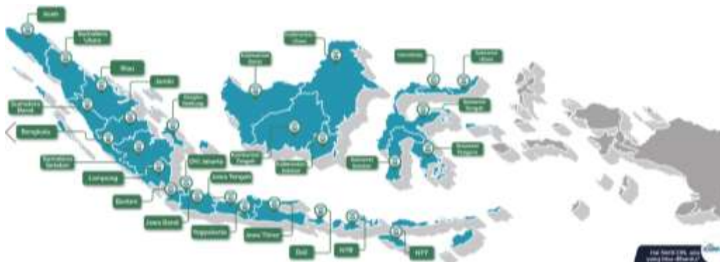
Gambar 1.4 Coverage Area Iconnet