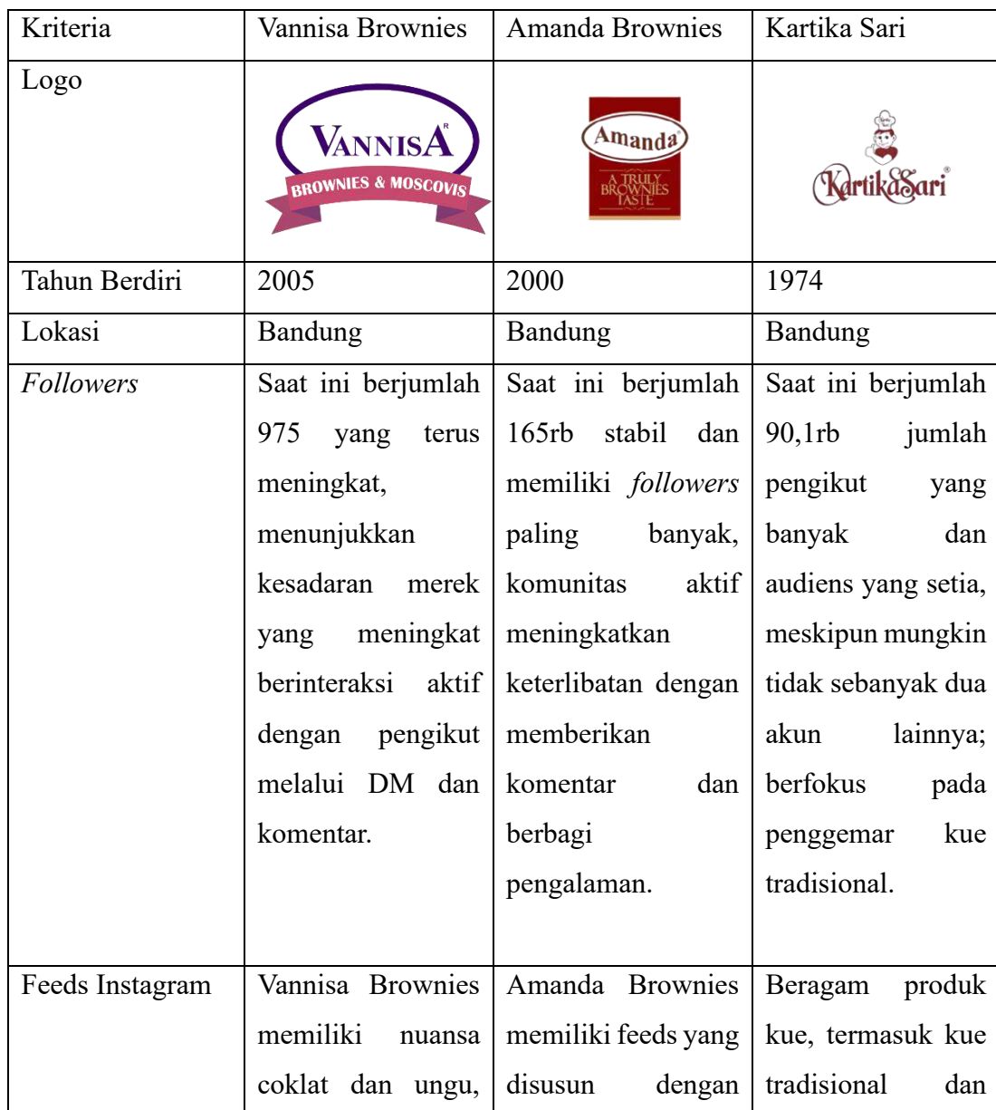
Tabel 1.1 Matriks Perbandingan Pesaing Sejenis

Sementara itu, Amanda Brownies menggunakan pendekatan feed yang lebih ahli dengan mempertimbangkan kualitas pada setiap produknya. Metode ini menciptakan citra merek yang lebih premium dan berkualitas tinggi, yang dapat meningkatkan persepsi pelanggan terhadap produk sebagai sesuatu yang lebih mewah dan bernilai lebih. Selain itu, penggunaan estetika yang lebih unik bertujuan untuk meningkatkan daya tarik visual. Dan untuk Kartika Sari menggunakan gaya feeds yang lebih bervariasi tidak hanya brownies tetapi juga menampilkan produk seperti pastry dan aneka kue lainnya. Lebih colorful dan menggambarkan kesan tradisional dan modern.