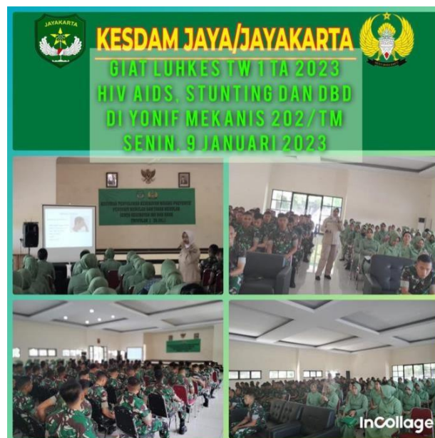
Gambar 1. 1 Penyuluhan Kesehatan Kesdam Jaya 2023

Dengan penyuluhan yang dilaksanakan secara teratur, Kesdam Jaya berhasil mencapai tujuannya yaitu meningkatkan kesadaran dan memotivasi prajurit untuk menjalani pola hidup sehat yang lebih baik. Program penyuluhan kesehatan yang telah dilaksanakan oleh Kesdam Jaya menunjukkan keberhasilan signifikan dalam merubah perilaku hidup sehat prajurit. Dengan beberapa aspek proses komunikasi yang telah dijalankan, program ini berpotensi memberikan dampak yang lebih besar dan berkelanjutan, tidak hanya bagi prajurit, tetapi juga bagi keluarga besar TNI AD secara keseluruhan karena Kesdam Jaya ikut andil secara signifikan dalam meningkatkan kesadaran dan menerapkan praktik hidup sehat di jajaran Kodam Jaya. Kesdam Jaya merupakan satuan kerja yang memberikan pelayanan kesehatan dan dukungan kesehatan terutama bagi Prajurit TNI AD, PNS dan keluarganya di jajaran Kodam Jaya/Jayakarta.