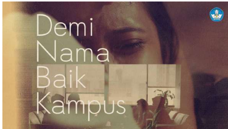
Gambar 1. 3 Poster Film Pendek “Demi Nama Baik Kampus”